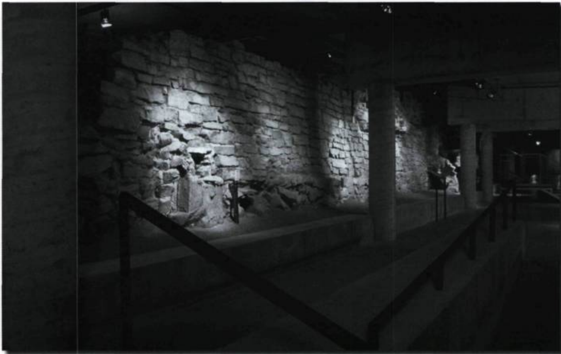
■ Mur des fortifications. Pointe-à-Callière, musée d'archéologie et d'histoire de Montréal.