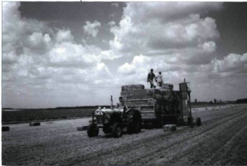
La fenaison à la ferme Beau-Regard à Saint-Eugène-de-Grantham (Drummond), à l'été 2000. (Photographie Yves Beaugard).

SRC : Secrétariat rural canadien (relève du ministère de l'Agriculture et de l'Agroalimentaire du Canada)