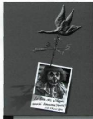
Document promotionnel de la Foire des villages tenue les 3 et 4 février 2001, au marché Bonsecours, de Montréal. Cet événement a attiré 5 000 visiteurs, en plus de séduire la presse nationale et régionale. Actuellement, Solidarité rurale du Québec est à évaluer l'ensemble des impacts de la Foire des villages. (Archives de l'auteur).

Jacques Proulx est président de Solidarité rurale du Québec.