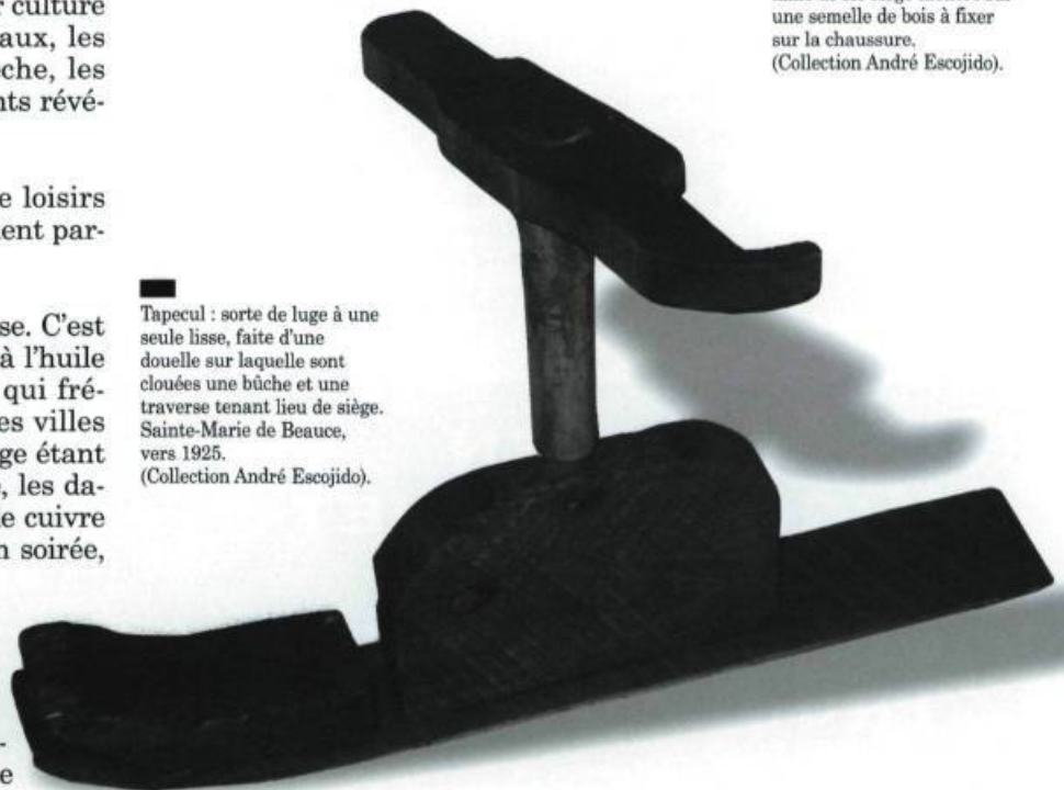
Tapecul : sorte de luge à une seule lisse, faite d'une douelle sur laquelle sont clouées une bûche et une traverse tenant lieu de siège. Sainte-Marie de Beauce, vers 1925. (Collection André Escojido).