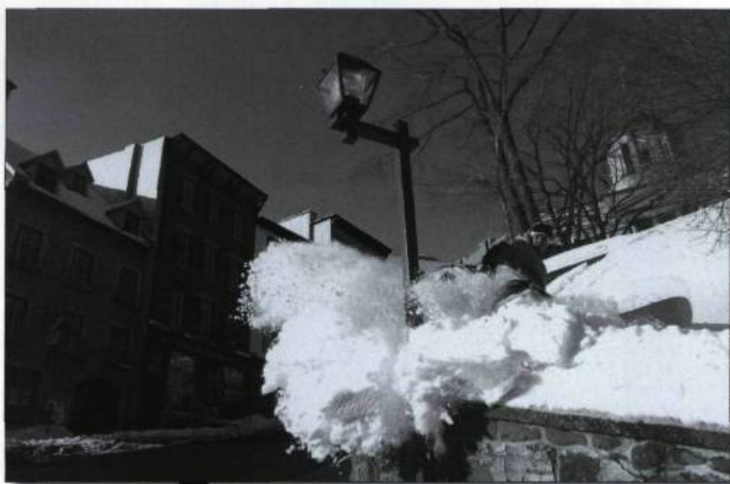
Partout où il y a de la neige....