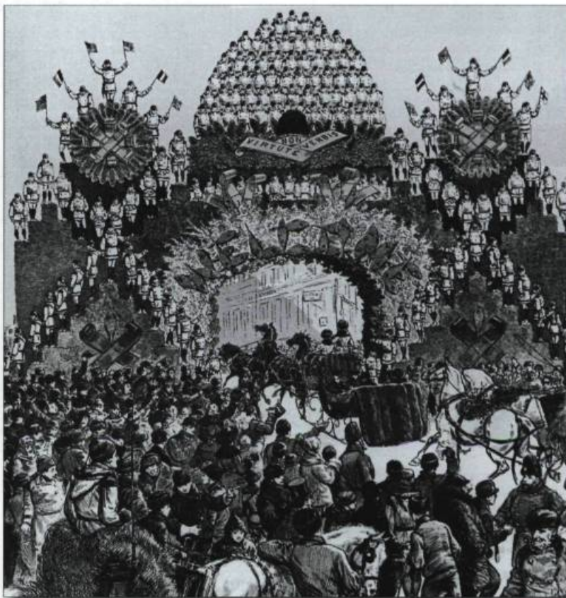
Le défilé du gouverneur général et le passage sous l'arc monumental des raquetteurs dit «arc vivants». Extrait : The Montreal Daily Star, Carnival Number, 1884.

le plus souvent, dans les salles appartenant aux clubs sportifs. À ces rencontres, s'ajoutent celles d'un nouveau sport : le hockey. Parmi les autres activités, signalons les courses en raquettes et les mascarades sur patins.