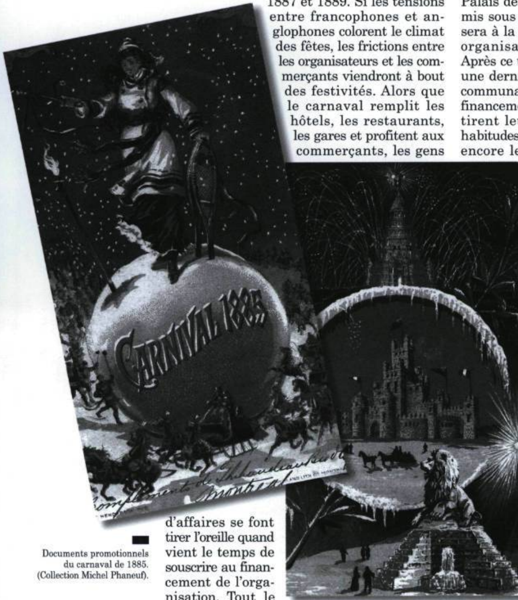
Documents promotionnels du carnaval de 1885. (Collection Michel Phaneuf).

En 1887, le carnaval de Montréal est à nouveau organisé. Il faut faire grand, très grand pour convaincre les Américains de préférer le carnaval de Montréal à celui de Saint-Louis. Palais de glace, glissoires, parades... tout est mis sous le signe du gigantisme et le déficit sera à la mesure des efforts déployés par les organisateurs. En 1888, rien ne va plus. Après ce temps d'arrêt, l'expérience est tentée une dernière fois, en 1889. Rien n'y fait, la communauté d'affaires refuse de participer au financement de ce genre d'activités. Les clubs tirent leur révérence et reprennent leurs habitudes d'antan. Ils continueront longtemps encore leurs activités, leurs rencontres amicales et leurs compétitions sportives mais jamais plus, à Montréal, ne les verra-t-on organiser un carnaval. Il y aura bien quelques résurgences de la fête à Québec, dans les années 1890, puis, à Montréal, en 1909 et 1910. Mais, les temps ont changé et avec elle l'esprit du carnaval. Alors que Saint-Paul, aux États-Unis, fera de la fête un événement annuel – maintenant centenaire –, ici, il faudra attendre la seconde moitié du XX e siècle à Québec, pour revoir une vraie grande fête hivernale autour d'un palais de glace, à la différence qu'il sera habité par un personnage emblématique «le Bonhomme», de duchesses et d'une reine. Mais ça c'est une autre histoire à raconter... ♥