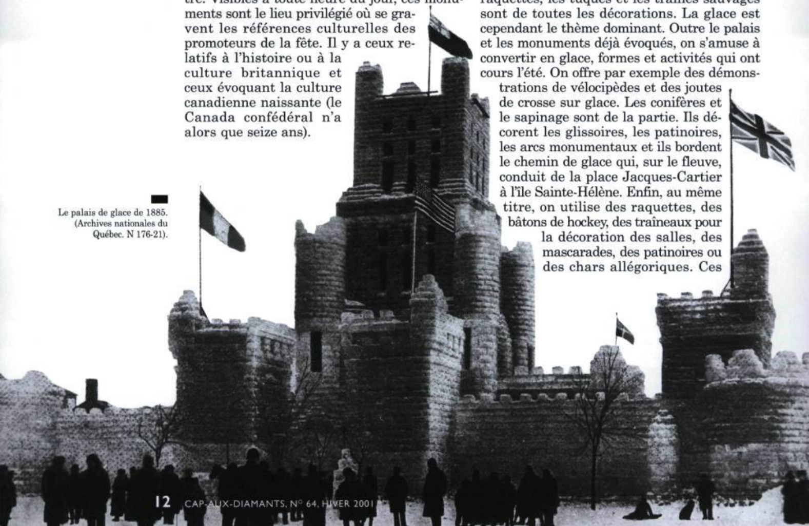
Le palais de glace de 1885. (Archives nationales du Québec. N 176-21).

strations de vélocipèdes et des joutes de crosse sur glace. Les conifères et le sapinage sont de la partie. Ils décorent les glissoires, les patinoires, les arcs monumentaux et ils bordent le chemin de glace qui, sur le fleuve, conduit de la place Jacques-Cartier à l'île Sainte-Hélène. Enfin, au même titre, on utilise des raquettes, des bâtons de hockey, des traîneaux pour la décoration des salles, des mascarades, des patinoires ou des chars allégoriques. Ces