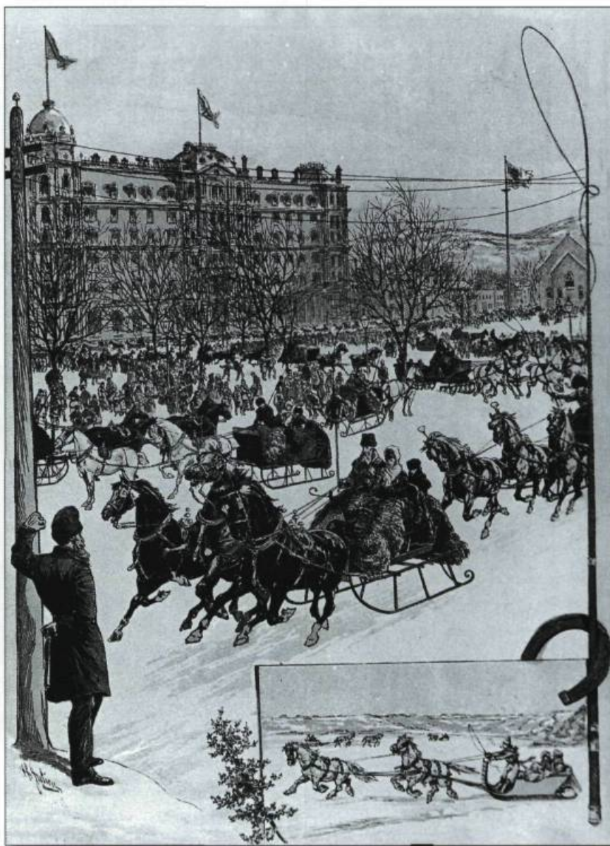
Une randonnée du Montreal Tandem Club lors du carnaval de 1885. Dessin Henri Julien. Extrait : The Montreal Daily Star, Carnival Number , 1885. (Archives de l'auteur).

mulées par leurs concitoyens de l'est de la ville. Après quelques tractations, il y a formation de deux grands comités qui mettent en place le programme du carnaval de 1885. Mais l'harmonie est précaire. Un rien la fait grincer et les frustrations sont nombreuses dans