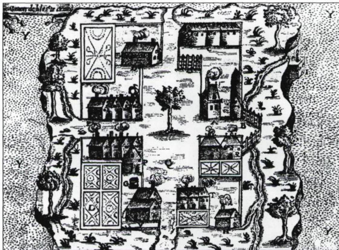
Autre illustration de Samuel de Champlain montrant l'établissement de l'île Sainte-Croix, vers 1604-1605, parue dans Voyages, en 1613.

maintenant de frontière entre le Canada et les États-Unis (Nouveau-Brunswick et Maine). Il choisit celle-ci surtout pour des considérations de sécurité. Dès que son choix fut arrêté, il mit ses ouvriers à l'œuvre et ils commencèrent à construire les différentes bâtisses devant servir de capitale à la nouvelle colonie. Champlain nous laissa un plan détaillé de l'établissement ainsi qu'un dessin des bâtisses qui s'y trouvaient. Cette