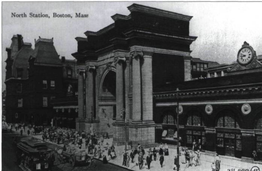
Boston. La gare du Nord, vers 1900. Carte postale John Valentine. (Fonds Magella-Bureau. Archives nationales du Québec à Québec).

C'est à l'été de 1911 que Desjardins donne le véritable coup d'envoi. Cédant aux demandes insistantes du nouveau commissaire des banques, Arthur B. Chapin, qui est déterminé à donner au mouvement naissant une forte impulsion, Desjardins consent à passer cinq semaines au Massachusetts, du 1 er juin au 6 juillet. En plus du remboursement de ses frais de voyage et d'hébergement, une allocation mensuelle de 200 $ lui est accordée. Mis au courant de sa venue, plu-