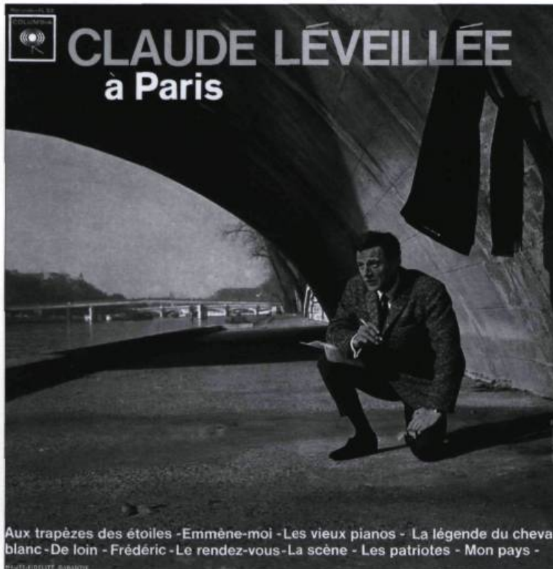
Aux trapèzes des étoiles - Emmène-moi - Les vieux pianos - La légende du cheval blanc - De loin - Frédéric - Le rendez-vous - La scène - Les patriotes - Mon pays -