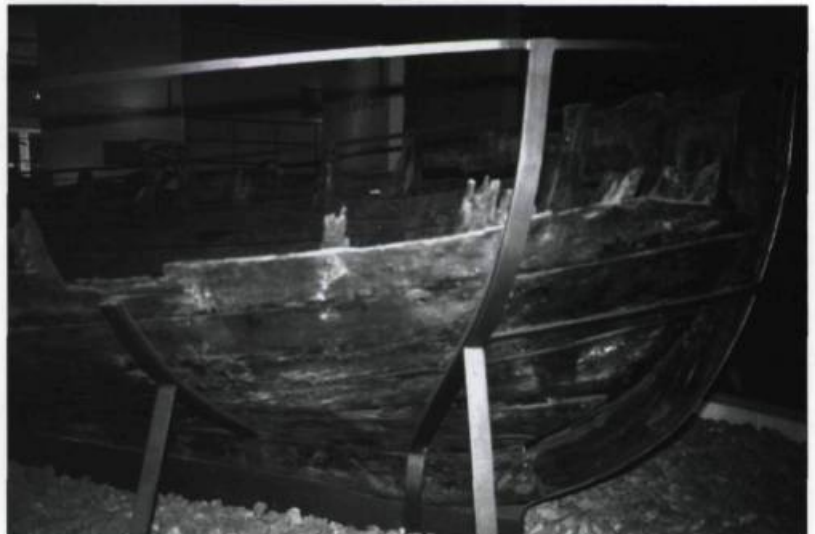
Barque retrouvée lors des fouilles archéologiques sur le futur site du Musée de la civilisation. (Collection Yves Beaugard).

d'archéologie de l'Université Laval. Plusieurs éléments enfouis furent retrouvés et analysés : les fondations et une tourelle du Magasin du Roy Samuel de Champlain, le premier palais de l'Intendant, l'éperon du Chantier naval royal (1739), la batterie Royale (1691) et la batterie Dauphine (1740), les cimetières Sainte-Anne et Sainte-Famille, la maison de Guillaume Couillard (1624).