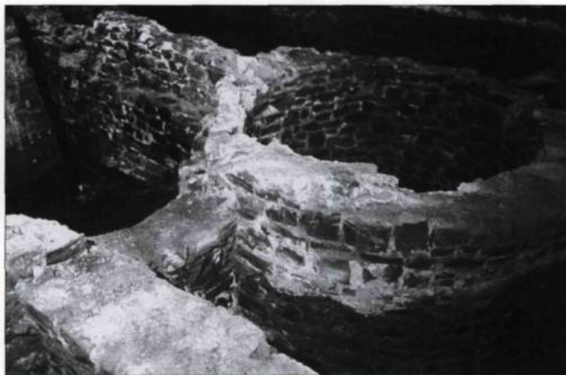
Vestiges de la seconde habitation de Samuel de Champlain (Magasin du Roy) lors des fouilles archéologiques à Place-Royale.

On ne compte plus aujourd'hui les livres, thèses, rapports et articles consacrés à Québec. Ce n'est pourtant qu'un siècle après la Conquête que des historiens commencèrent à se pencher sur la ville de Québec de la Nouvelle-France. Au milieu du XIX e siècle, des érudits de Québec, les Georges-Barthélemy Faribault, Charles-Honoré Laverdière et Henri-Raymond Casgrain publiè-