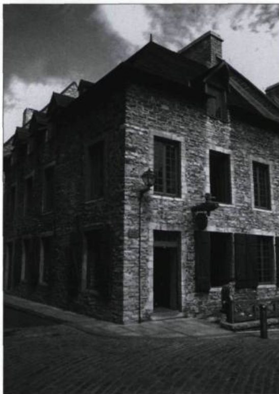
L'une des maisons reconstituées de Place-Royale. (Collection Yves Beaugard).

(La Documentation québécoise. Éditeur officiel du Québec).