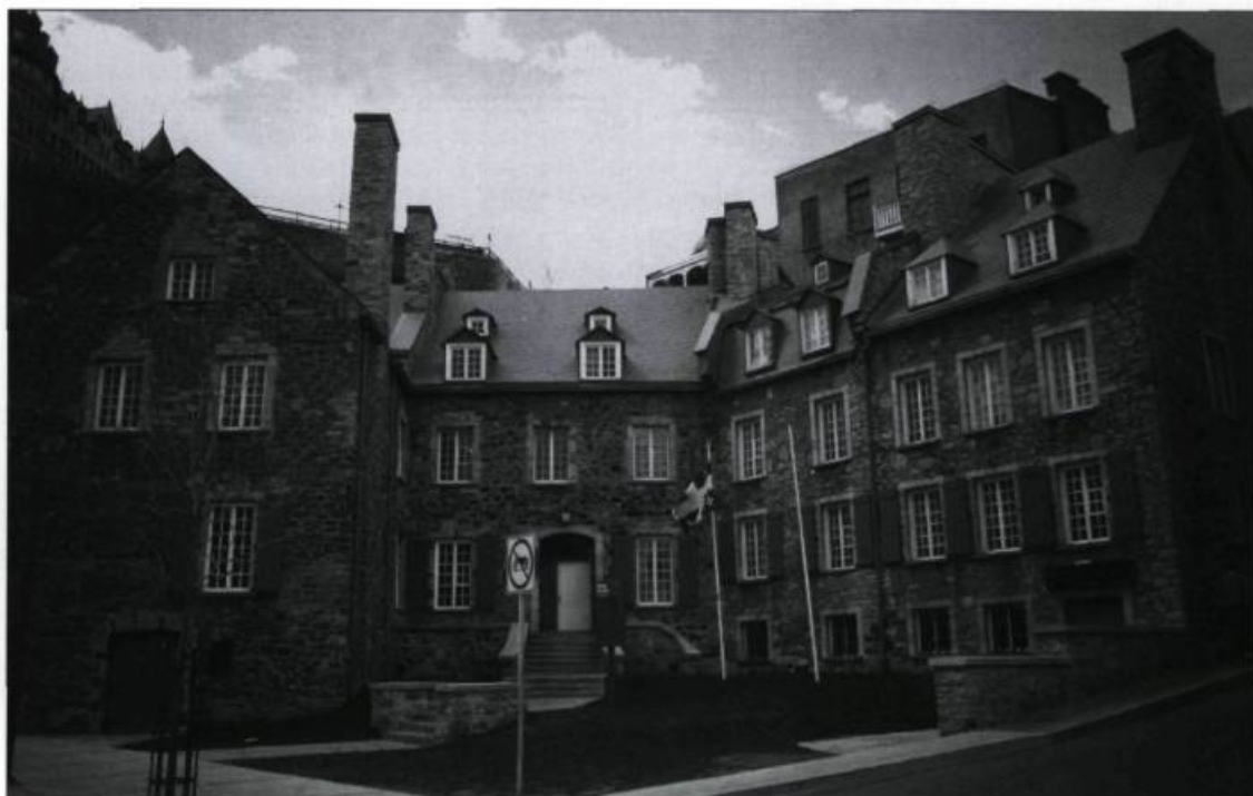
La maison Chevalier acquise et restaurée à partir de 1957 par la Commission des monuments historiques.

À la quête identitaire s'est joint, plus ou moins consciemment, le désir de plaire au touriste. Des esprits romantiques du XIX e siècle édifièrent une porte Saint-Louis et un Manège militaire d'aspect médiéval. Des esprits aguicheurs du tournant