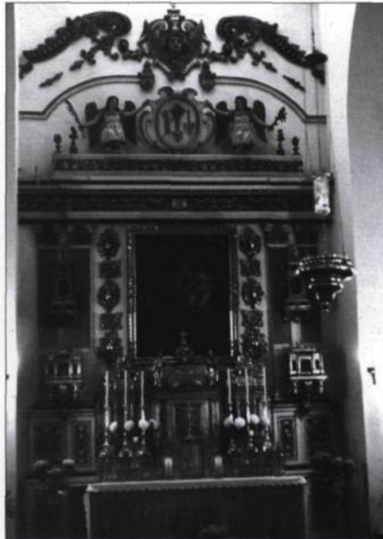
Autel du Sacré-Cœur de la chapelle des ursulines. (Collection Yves Beaugard).

Ce n'est toutefois qu'au début des années 1970 que furent entreprises des recherches archéologiques systématiques et structurées. Des fouilles furent menées par Parcs Canada, le ministère des Affaires culturelles, la Ville de Québec et l'École