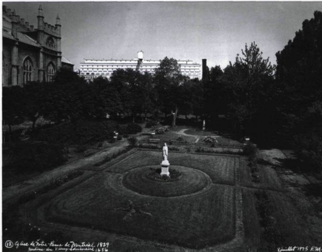
«Le manoir des seigneurs...» Le Séminaire de Saint-Sulpice de Montréal est toujours habité par les sulpiciens depuis 1685.