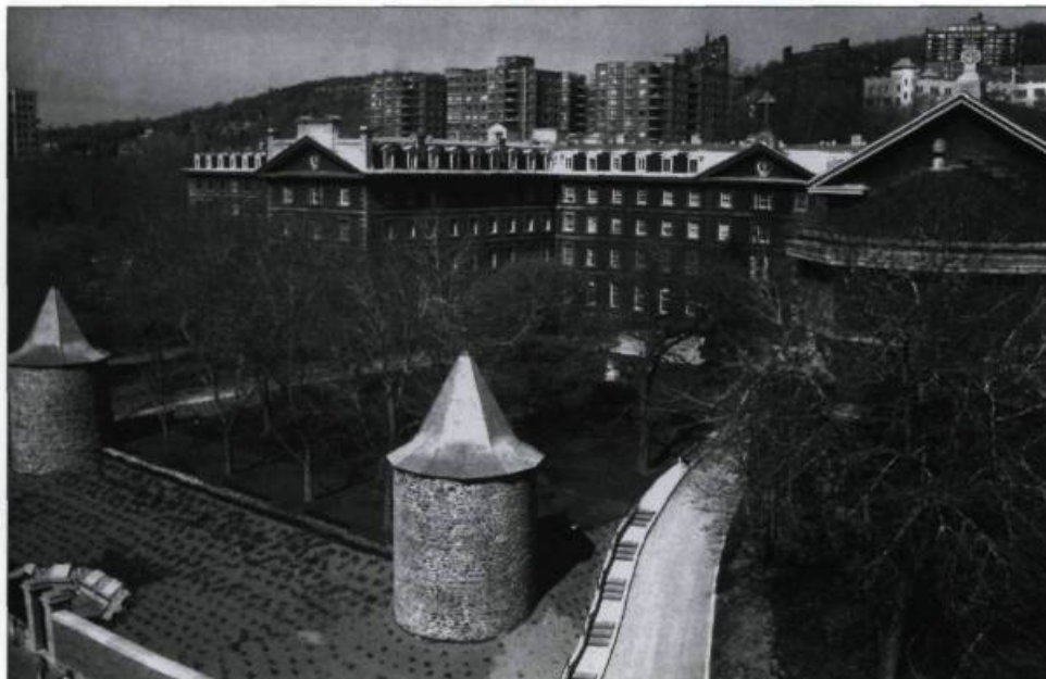
Le Grand séminaire de Montréal de 1857 est toujours dirigé par les sulpiciens. Photographie : Claude Turmel, 1990. (Archives de Saint-Sulpice, Montréal).

Cependant, par la force des circonstances, un souci est devenu majeur : la formation des prêtres. Dès 1840, M re Bourget demandait aux sulpiciens de fonder le Grand Séminaire de Montréal. Plus de 6 000 prêtres y ont été formés à ce jour. En 1888, ce fut le début du Collège canadien de Rome qui accueille les prêtres étudiants. Au Canada, les sulpiciens ont dirigé aussi le Grand Séminaire de Saint-Boniface de 1954 à 1968, et sont responsables du Grand Séminaire d'Edmonton depuis 1990. De plus,