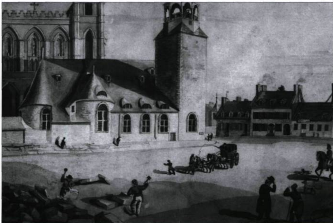
La première église Notre-Dame de Montréal fut terminée en 1683. On l'aperçoit ici au moment où s'achève la construction de la nouvelle église. Gravure de Robert Auchmaty Sproule, 1830.

Les sulpiciens voulaient être missionnaires auprès des autochtones. Durant la première décennie, ils