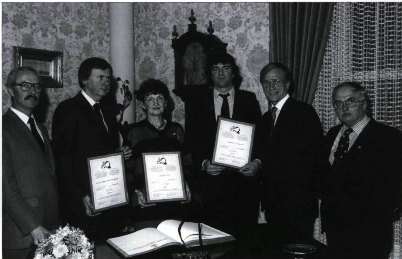
Remise du titre «Les amis du patrimoine» à l'équipe de la Caisse par la Ville de Québec, en octobre 1985.