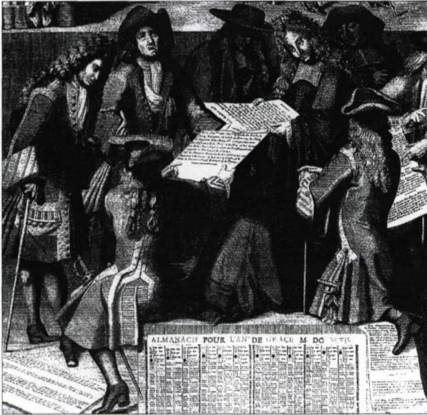
Ces personnages figurent sur un almanach datant de 1696. Les deux individus qui sont représentés de dos portent des justaucorps dont le galonnage offre des similitudes frappantes avec le vêtement reproduit ci-contre. C'est l'un des éléments qui nous permet de situer cet habit dans le temps. (Collection privée).

sentons et c'est probablement ce luxe qui a valu à ce vêtement d'être conservé de génération en génération.