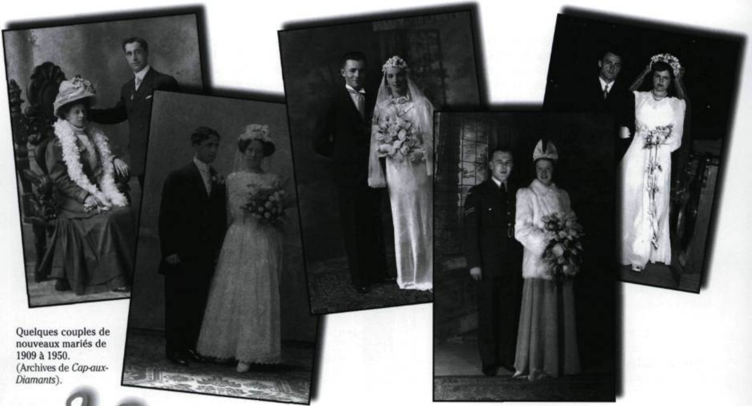
Quelques couples de nouveaux mariés de 1909 à 1950..