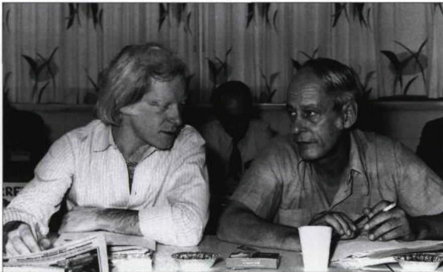
René Lévesque et Pierre Bourgault à la réunion du Conseil national du Parti québécois à Chicoutimi, le 11 septembre 1971.

P.B. : Oui, on en faisait beaucoup, de même que des manifestations. Lévesque