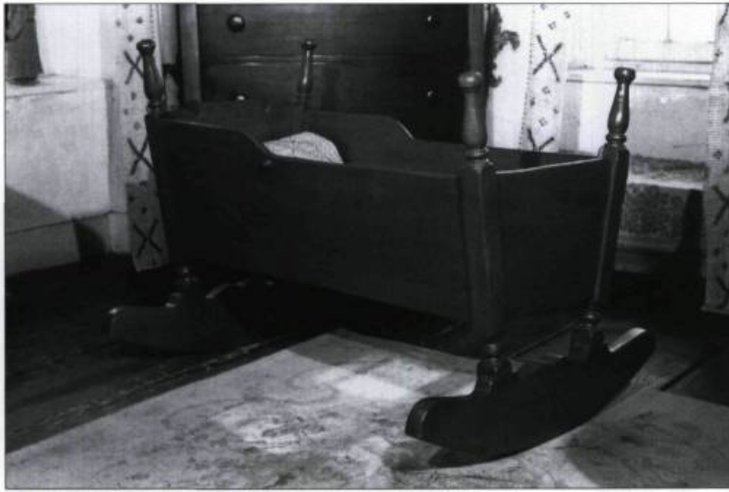
Berceau à quenouilles, à chevet et patins chantournés, XIX e siècle. (Ministère de la Culture et des Communications, Québec).

autobiographiques rédigées à l'intention de son fils Paul-Louis, il ajoute : «Les travaux de restauration du Manoir furent faits sous la direction de l'architecte Lorenzo Auger et une fois les réparations finies, je m'appliquai à meubler la maison avec des meubles antiques que je recueillis spécialement dans l'île d'Orléans et au Manoir de Berthier.»