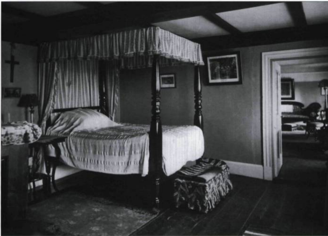
Une chambre à coucher vers 1930. (Ministère de la Culture et des Communications, Québec).

valeurs. Une idée se forme en lui, celle de créer dans son antique demeure un véritable musée du terroir .