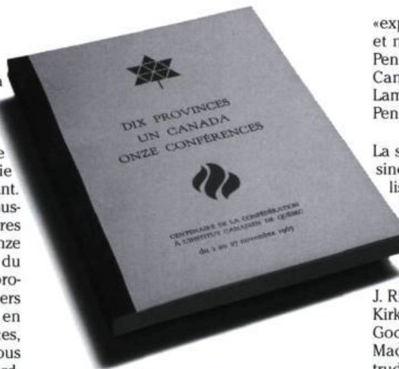
Ouvrage publié par L'Institut Canadien pour diffuser les dix conférences du centenaire de la Confédération tenues sous les auspices de L'Institut. Photographie Brigitte Ostiguy, 1998. (Archives de L'Institut Canadien).

«L'Institut poursuit ainsi sa mission culturelle et pense contribuer de cette façon à sa vocation spirituelle et sociale, partant à l'unité du pays» avait déclaré le D r Lachance en ouvrant la session. Pour atteindre ce but, il avait invité onze personnalités canadiennes-anglaises «les plus éminentes et les plus représentatives de chacune des dix provinces», avait-il ajouté.