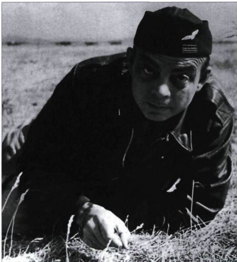
Le pilote de guerre Antoine de Saint-Exupéry, immortalisé par le succès de son Petit Prince, donna une conférence devant les membres de L'Institut Canadien en 1942.