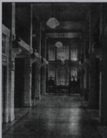
Vue de la bibliothèque de L'Institut Canadien alors qu'elle logeait au Palais Montcalm de 1932 à 1944.

À compter de 1950, avec l'ouverture des succursales ou bibliothèques de quartier, le personnel de L'Institut se multiplia et se spécialisa. En 1964, afin de superviser les activités de L'Institut qui prenaient de l'ampleur, un premier directeur général entra en fonction, Roland Nadeau. Au cours des ans, des spécialistes en bibliothéconomie, en animation, en relations publiques et en administration se joignirent à la grande équipe de L'Institut Canadien et du réseau de la Bibliothèque de Québec. ♦