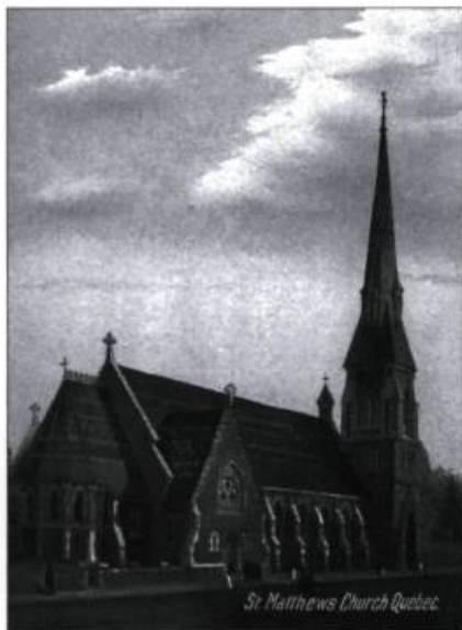
L'ancienne église est ornée de contreforts et dominée par la tour de son clocher. Vue de la rue Saint-Jean. Carte postale European Post Card Co., Montréal, vers 1905. (Collection Yves Beauregard).

En réaction au matérialisme croissant du XIX e siècle, les ecclésiologistes rejetèrent l'architecture de l'époque précédente. Cette architecture reflétait, selon eux, l'érosion graduelle des valeurs spirituelles dans l'Église anglicane depuis la Réforme. Les ecclésiologistes axèrent principalement leurs efforts sur l'architecture des petites églises paroissiales, voyant en celles du Moyen-Âge l'image d'une époque où la vie en Angleterre était bien meilleure. Ils croyaient déterminer un havre de grâce dans les cités surpeuplées et matérialistes du XIX e siècle.