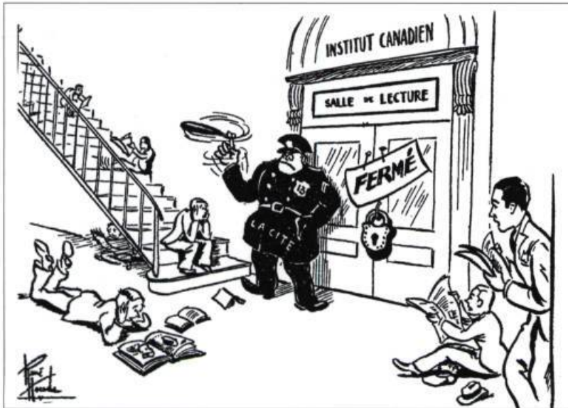
Cette caricature de Raoul Hunter parue en 1941 dénonçait la fermeture de la salle de lecture de L'Institut Canadien par les autorités municipales (Le Soleil, le 5 février 1941).

de porter plus haut ses aspirations.» L'occasion se présenta finalement. La maison Bilodeau, un haut édifice de la côte de la Fabrique, construit jadis pour le marchand Bilodeau et appartenant à la succession de l'homme d'affaires George Burns Symes, était disponible. L'Institut en fit l'acquisition le 4 février 1882. C'est la fille du défunt, Clara Symes, devenue la marquise de Bassano en épousant le petit-fils d'un grand chambellan de l'empereur Napoléon III, qui signa l'acte de vente. L'Institut loua le rez-de-chaussée au magasin de musique d'Arthur Lavigne et s'installa aux étages supérieurs. Entre une «double procession de colonnes», selon l'expression d'Adolphe-Basile Routhier, furent placées les armoires de livres de la bibliothèque.