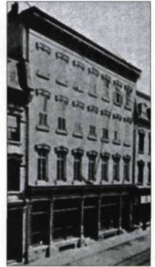
L'imposant édifice de la Caisse d'économie de la rue Saint-Jean.

Mais, de nouveau, L'Institut se trouva à l'étroit. En février 1877, le président Édouard Rémillard soulignait qu'à l'instar des membres de l'Institut canadien-français d'Ottawa, les gens de Québec devraient doter L'Institut Canadien de son propre édifice. Ses vœux ne se réaliseront que cinq ans plus tard.