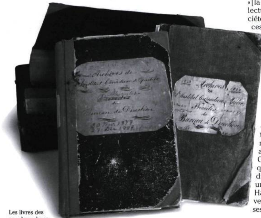
Les livres des procès-verbaux du «bureau de direction» de L'Institut Canadien. Photographie Brigitte Ostiguy, 1998. (Archives de L'Institut Canadien).

relles, fait figure de doyen. La plupart des autres membres sont dans la vingtaine. Tous désirent se prendre en main pour parfaire leur culture et perfectionner leur art oratoire tout en servant la communauté. En effet, d'après le modèle du