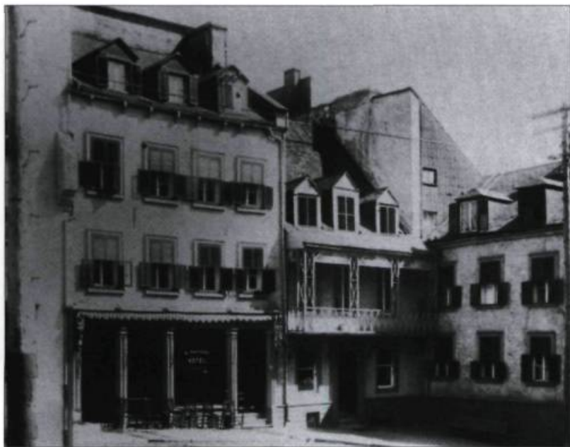
L'hôtel Blanchard de la place Royale où se réunirent les fondateurs de L'Institut Canadien et qui devint plus tard l'hôtel Louis XIV.

E n janvier 1848, avait lieu dans l'ancienne salle de la bibliothèque du Parlement, la fondation de L'Institut Canadien de Québec. Par sa longévité et par son retentissement, cette société qui a marqué profondément la ville de Québec attire notre attention parce