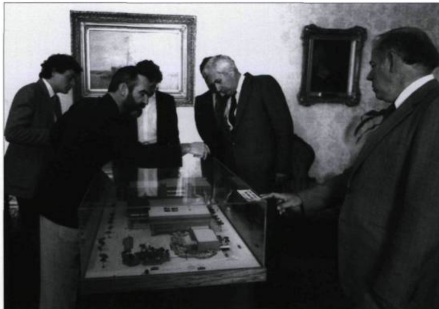
Observation à l'hôtel de ville de la maquette de la future bibliothèque Gabrielle-Roy.

1948 Célébrations du 100 e anniversaire. / Dévoilement de 3 plaques commémoratives. / Grand concours littéraire inter-