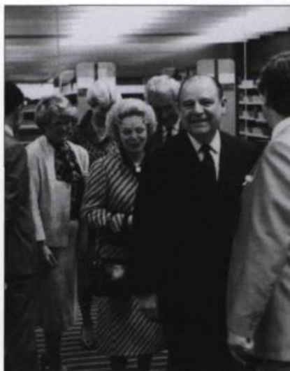
Raymond Barre, premier ministre de France, visite la nouvelle bibliothèque Centrale, en 1983.

1985 La bibliothèque Centrale devient la bibliothèque Gabrielle-Roy. / Ouvertures des bibliothèques Saint-Albert, Saint-