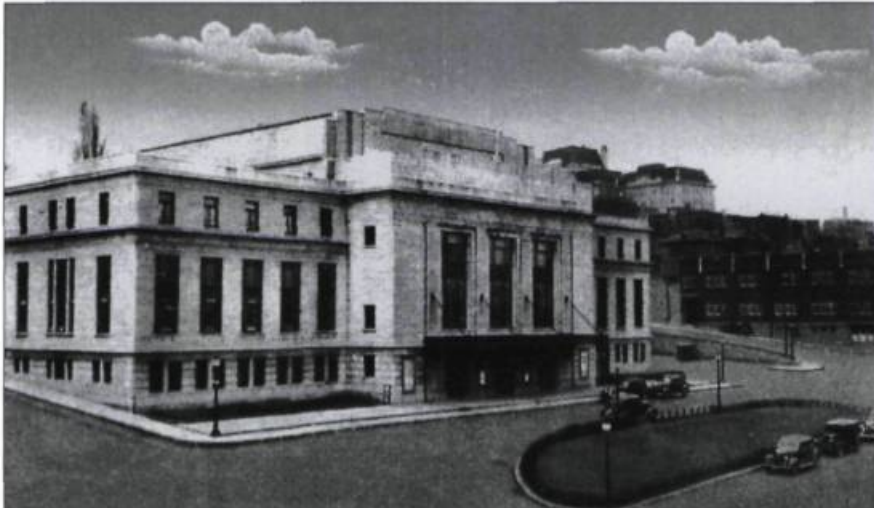
Avec bonheur, L'Institut Canadien s'installe en 1932 dans le tout nouveau Palais Montcalm. Carte postale, Librairie Garneau ltée. (Collection Yves Beauregard).

1932 L'Institut s'installe dans le nouveau Palais Montcalm, à la place d'Youville. / L'Institut a désormais son Livre d'Or.