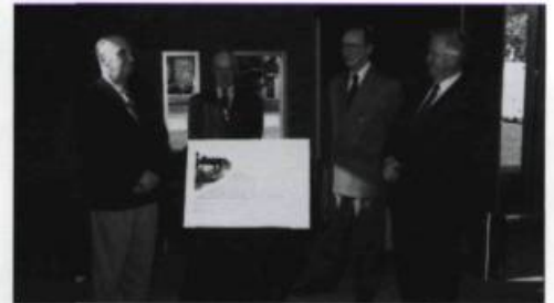
Inauguration de la bibliothèque Jean-Baptiste-Duburger, en présence du maire Jean-Paul L'Allier, en 1997.

1993 Les festivités «Dix chandelles pour Gabrielle!» soulignent le 10 e anniversaire de la bibliothèque Gabrielle-Roy. / En 1993 et 1994, L'Institut réévalue sa mission.