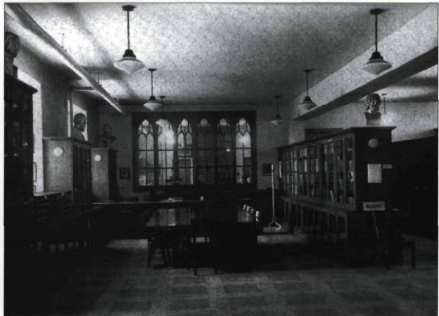
La salle de lecture de L'Institut Canadien en 1948, au rez-de-chaussée de l'ancienne église Wesley.

1898 Inauguration des salles et de la bibliothèque de L'Institut à l'hôtel de ville. / Célébrations du 50 e anniversaire. / Parution du quatrième catalogue de la bi-