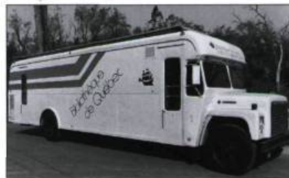
Le Bibliobus parcourt les rues de la ville de 1979 à 1986..

1972 Célébrations du 125 e anniversaire. Fête populaire à la place Royale.