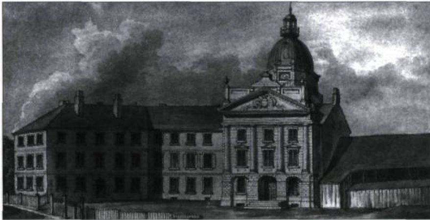
Ce dessin de Kollner, illustrant le parlement, date de 1848, l'année même où L'Institut Canadien s'y installe.

1847 Le 2 décembre, huit jeunes Québécois se réunissent à l'hôtel Blanchard pour établir les bases de la fondation d'un institut canadien à Québec. / Au même endroit, le 13 décembre, une nouvelle réunion a lieu pour discuter du rapport du comité provisoire et du projet de constitution.