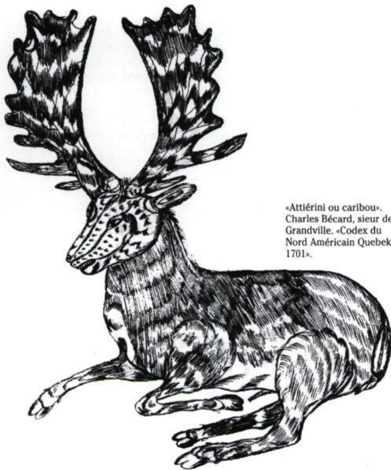
«Attériini ou caribou». Charles Bécard, sieur de Grandville. «Codex du Nord Américain Quebec, 1701».

T ous les auteurs qui ont décrit la faune du continent nord-américain ont souligné sa diversité et, surtout, son abondance. Même si certaines espèces commençaient à se faire rares, du moins à proximité des centres d'habitation, les observateurs européens de la seconde moitié du XVII e siècle restent