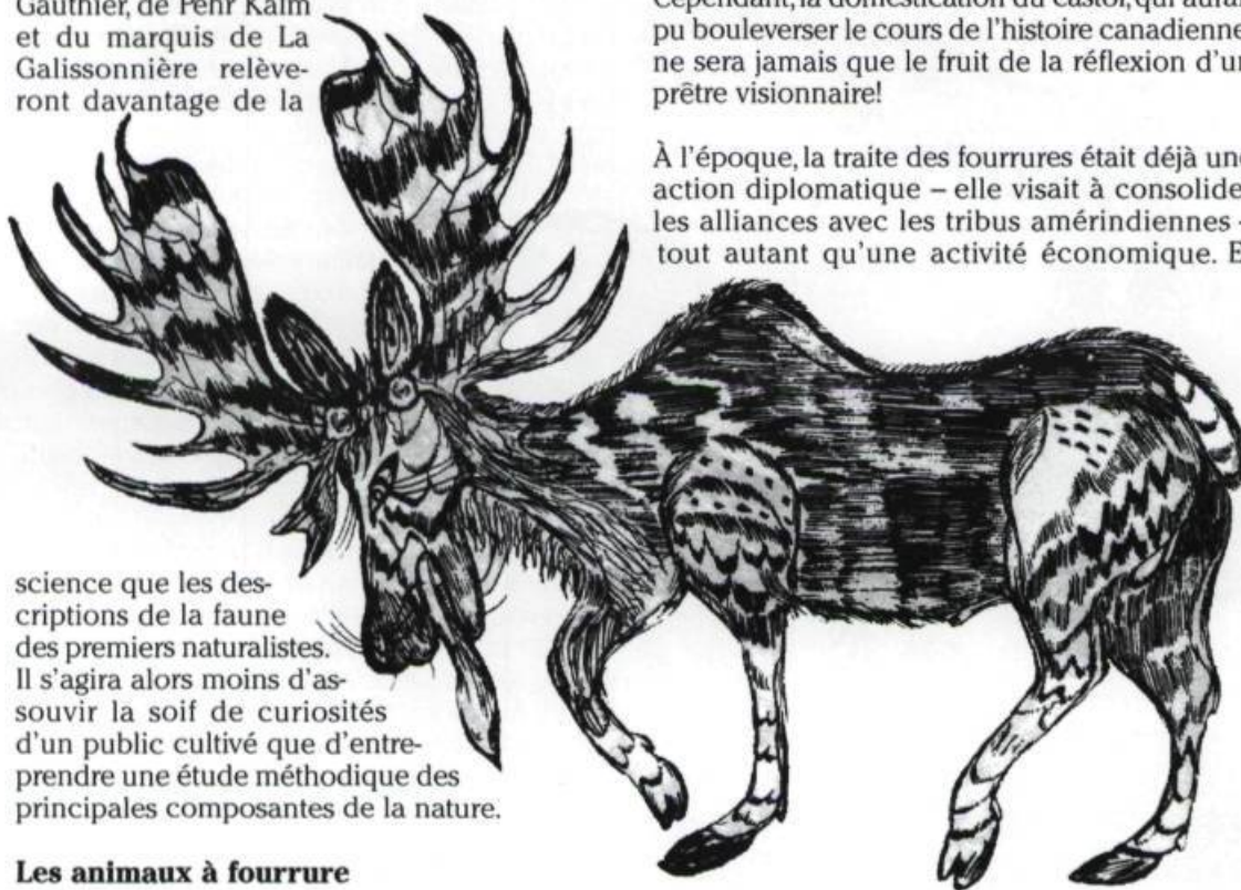
«Élan d'Amérique ou original». Charles Bécard, sieur de Grandville. «Codex du Nord Américain, Quebec, 1701».

À l'époque, la traite des fourrures était déjà une action diplomatique – elle visait à consolider les alliances avec les tribus amérindiennes – tout autant qu'une activité économique. Et