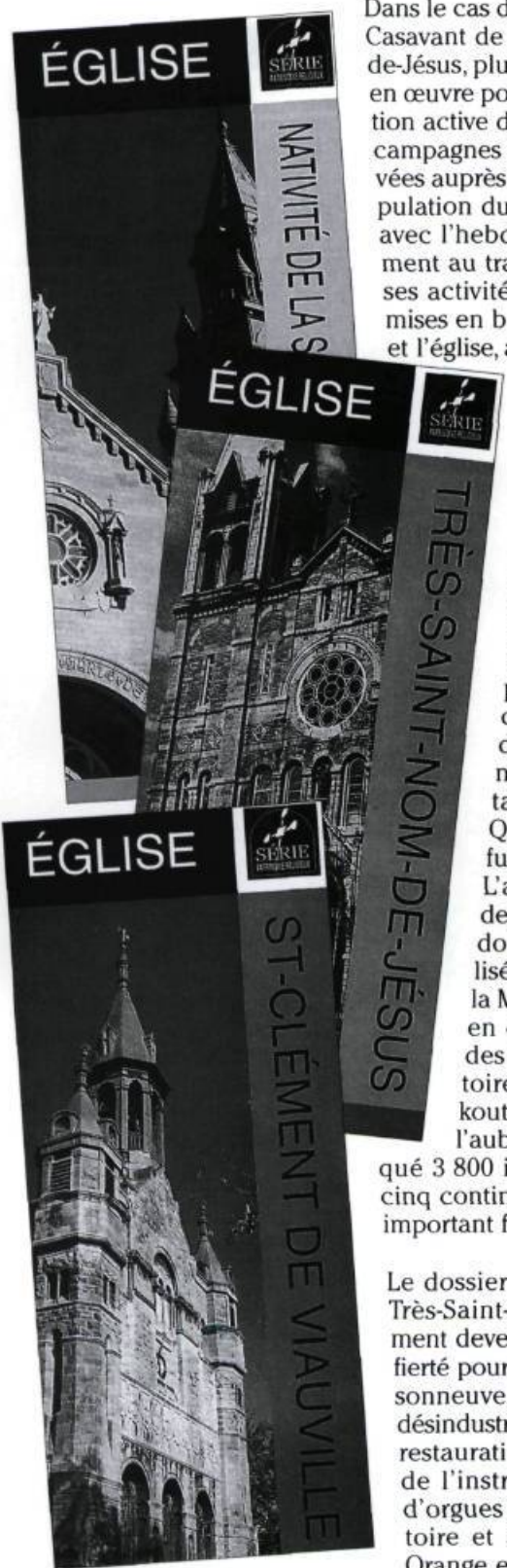
Dépliants réalisés par l'Atelier d'histoire sur quelques églises patrimoniales du quartier Hochelaga-Maison-neuve.