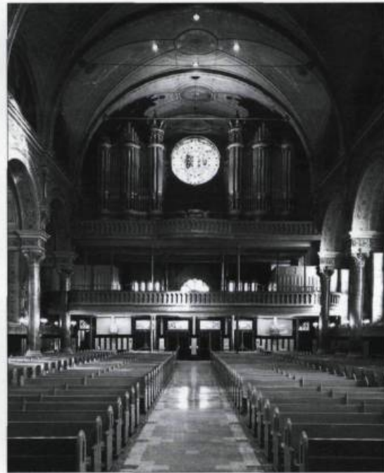
Église du Très-Saint-Nom-de-Jésus : à gauche, vue de l'orgue de chœur et du tableau «La Pentecôte» attribué à Georges Delfosse. À droite, l'orgue de tribune, un chef-d'œuvre signé Casavant.

L'événement, une première canadienne, a aussi attiré l'attention sur les conditions de vie des familles ouvrières à la fin du XIX e siècle, période où la majorité des logements ouvriers étaient dépourvus de commodités aussi élémentaires qu'une baignoire et l'eau chaude.