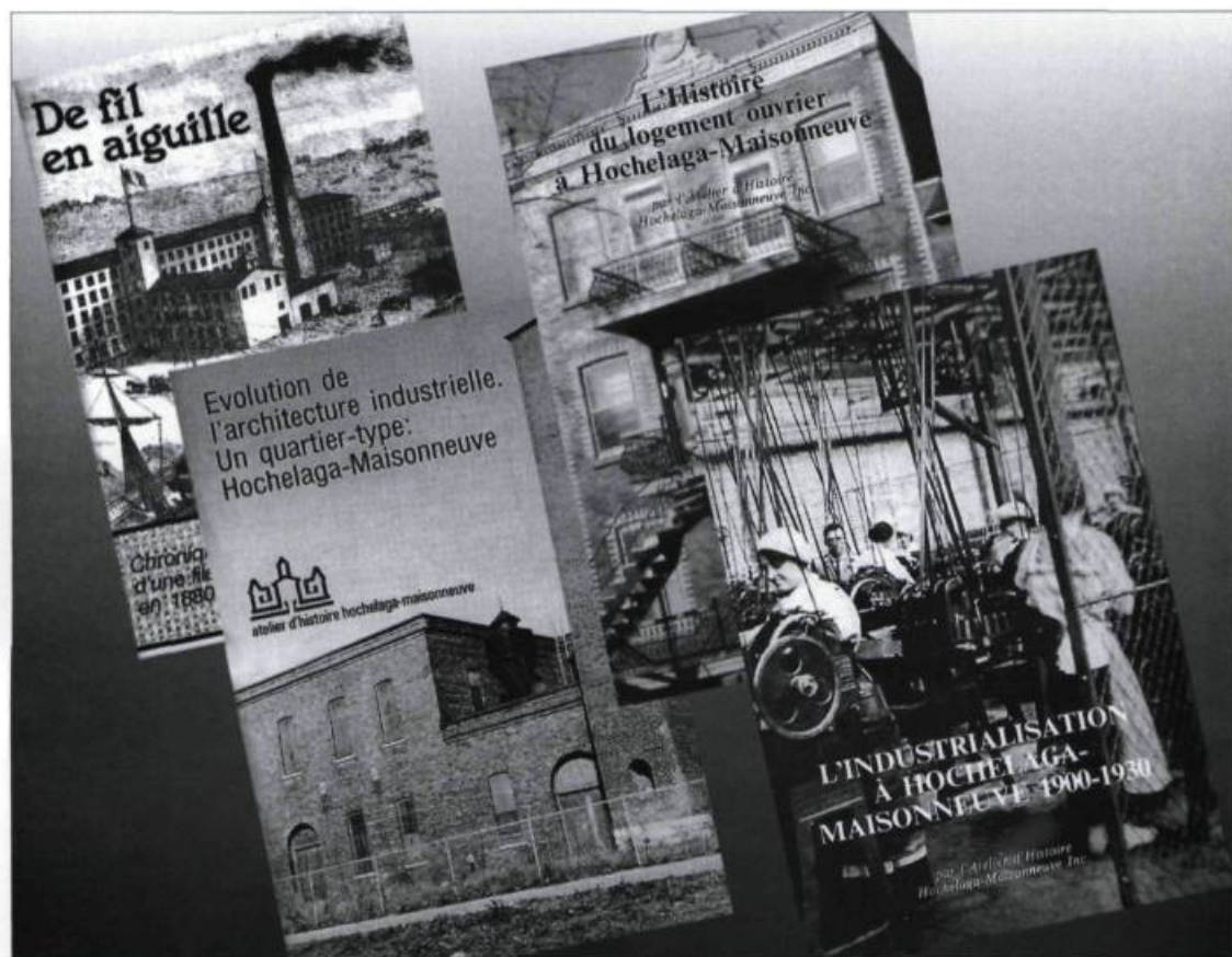
Quelques publications élaborées par l'Atelier d'histoire Hochelaga-Maisonnette depuis 1980.

L'Atelier d'histoire contribue à l'élaboration de l'Opération patrimoine populaire, organisée conjointement par la Ville de Montréal, Héritage-Montréal et les groupes voués à la préservation du patrimoine montréalais. Cette activité vise à rendre hommage aux acteurs qui interviennent