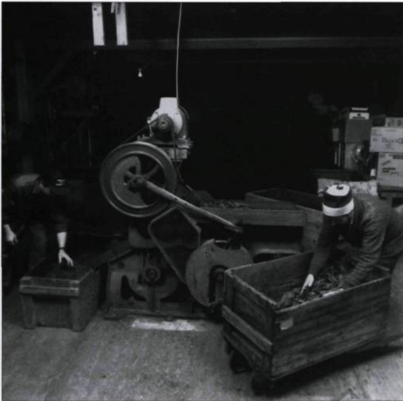
Des employés de la «manufacture de tabac J. O. Forest et Cie enr.», de Saint-Roch-de-l'Achigan, procédant au broyage des feuilles. L'entreprise centenaire est l'une des dernières fabriques du Québec à préparer le tabac de façon artisanale. Photo : Louise Leblanc, 1992.(MCCQ).

textes économiques. Ces pratiques s'actualisent à travers des personnes : les porteurs de traditions . Le porteur de traditions est l'agent transmetteur par qui se perpétue la mémoire des savoirs et des savoir-faire.