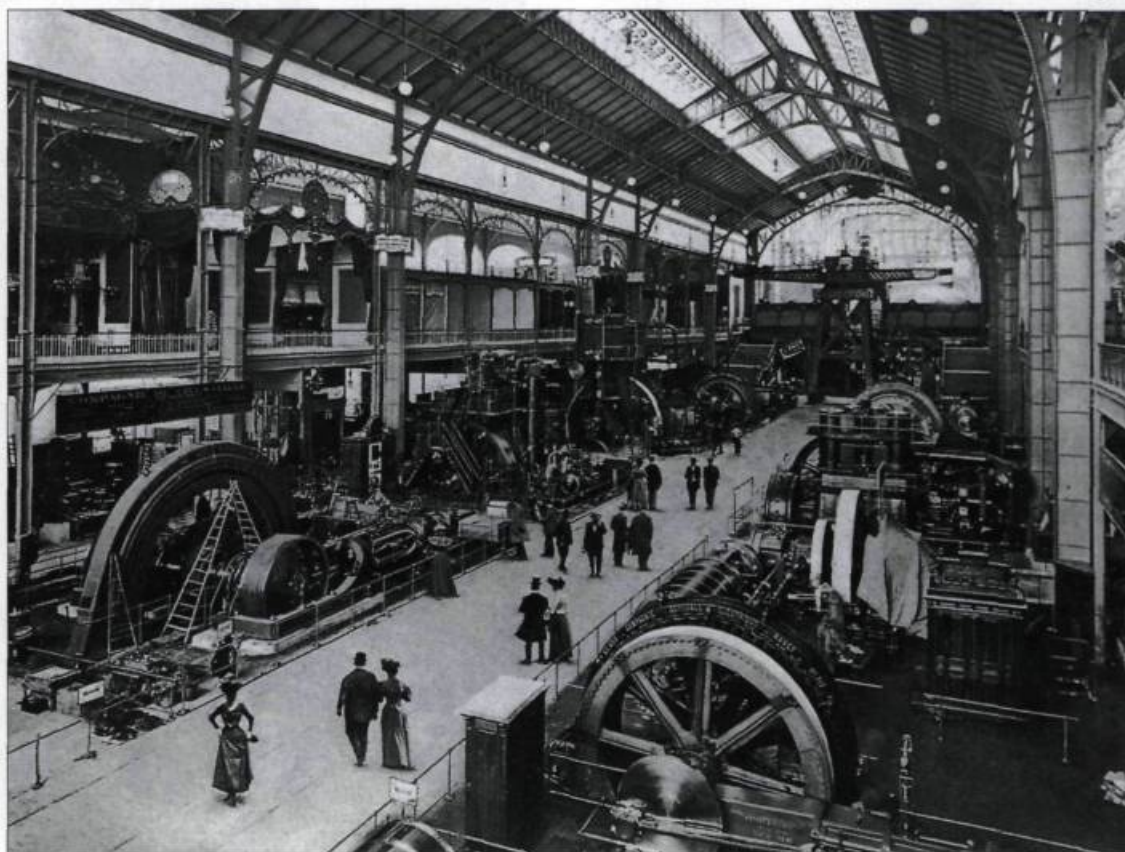
La galerie des machines. En 1900, pour la première fois, les machines regroupées dans un même espace, jadis à la vapeur dans une exposition précédente sont toutes électriques. La révolution industrielle entre dans le XX e siècle. (Collection privée).

que nous fait un premier mois de séjour, c'est que Paris est une ville considérable, merveilleuse; la ville par excellence, la ville unique au monde, la ville-carrefour où tout l'univers vient, la ville où le beau revêt mille formes, où les attractions de tous genres de l'Exposition scintillent à la lumière ardente. On voit que dans cette incompa-