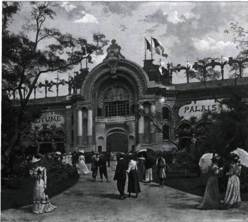
La Belle Époque réinvente la mode. Deux palais sont consacrés à ce volet de l'art textile qui fait la gloire de Paris : Palais des fils, tissus et vêtements et le Palais du costume que l'on peut voir ici aux jardins animés de femmes élégantes portant ombrelles. (Collection privée).

Le Grand Palais des beaux-arts et le Petit Palais des arts décoratifs qui encadrent la nouvelle avenue Nicolas II ont été projetés, aménagés et bâtis en trois ou quatre ans. Le pont Alexandre III, considéré comme un chef-d'œuvre du génie civil avec son arche unique de 107 mètres de portée, a été lancé aussi rapidement pour relier cette nouvelle avenue à l'esplanade des