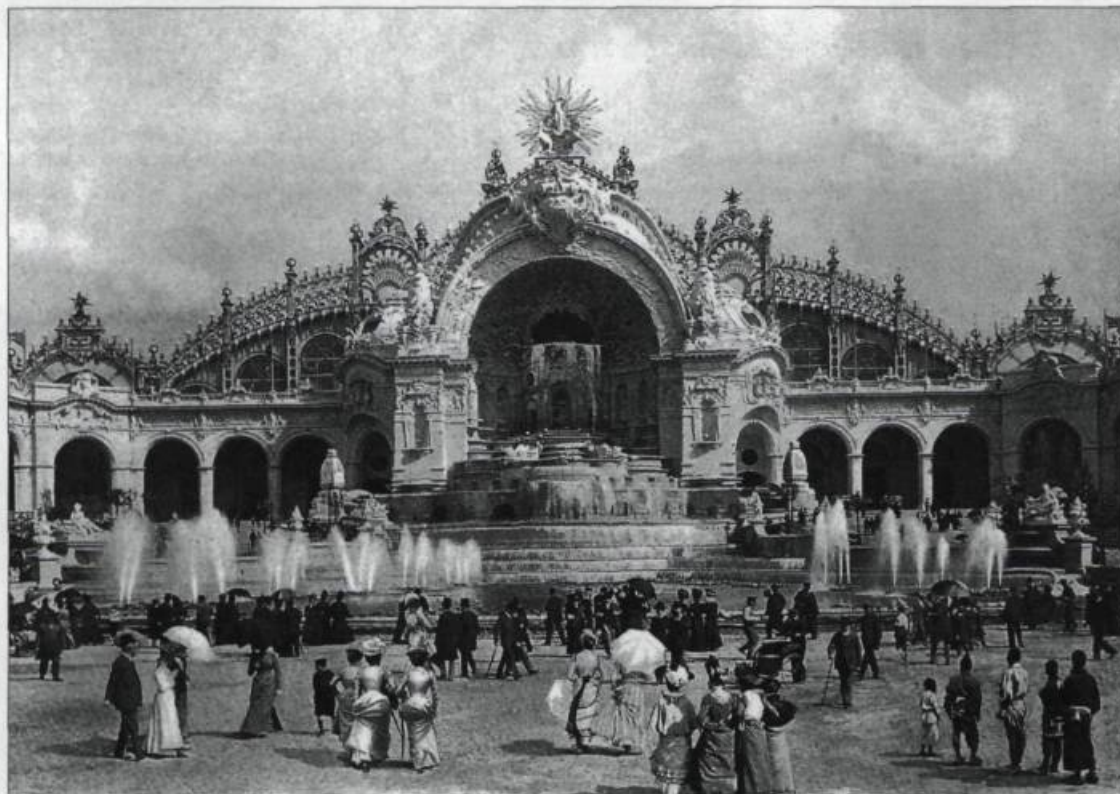
Le Palais de l'électricité et le Château d'eau demeurent le don féérique de l'Exposition à l'ère naissante de cette nouvelle source énergétique. D'autres bâtiments comme le Palais des illusions et la porte monumentale la nuit, éblouissent les visiteurs laissant entrevoir la révolution qui s'amorce au XX e siècle.

leurs mœurs propres, leurs instincts, leurs croyances et cela dans le décor qui leur est particulier.» La planète se donne en spectacle à Paris, qui du coup, s'intitule sans vergogne, «reine du monde». L'Occident, il est vrai, achève cette année-là de conquérir les continents, de les partager en grands empires. La Terre, grâce au progrès technique, est devenue toute petite : des héros de roman démontrent, avec vraisemblance, qu'on peut en faire le tour en 80 jours. Voilà pour l'idée générale. Mais elle s'accompagne d'une idée scientifique. C'est l'idée lumière, c'est l'électricité, cette fée qui illumine le monde. De cette volonté de promouvoir à la fois l'électricité et l'union de l'humanité, l'entrée monumentale de l'Expo, la porte Binet, a sans doute voulu témoigner.