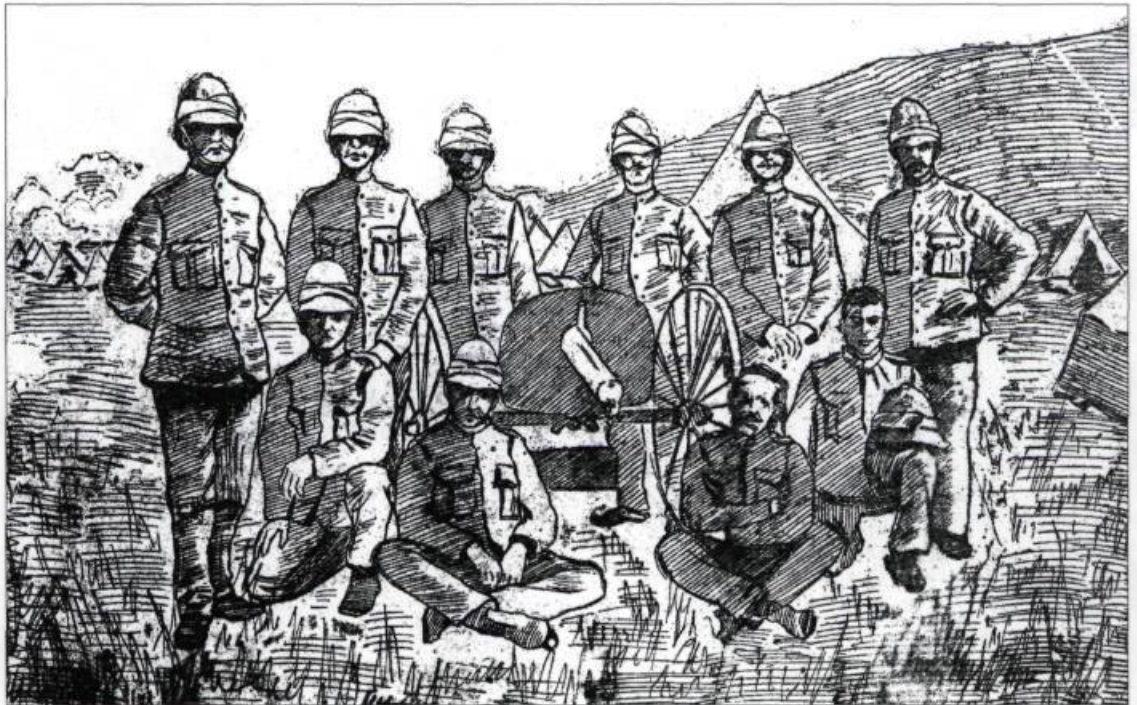
Cette illustration tirée d'une photographie de Lucien LaRue montrant un groupe de Québécois est parue à la une du quotidien Le Soleil , le 20 février 1900. Le photographe a été blessé et est mort en Afrique le 24 juin 1900.

Cependant, plus que l'héroïsme, c'est l'attrait du voyage et de l'aventure qui fut à l'origine de beaucoup d'engagements. Au début de la guerre, lorsque celle-ci semblait une simple promenade militaire, la proportion de volontaires nés au Canada était élevée. Par contre, dès que le conflit s'avéra coûteux en vies humaines, les volontaires se firent plus rares chez les Canadiens de souche. Il ne faut donc pas s'étonner de la faible participation des Canadiens français qui n'ont fourni que 4% des effectifs, alors qu'ils comptaient pour plus de 30% de la population canadienne. Il faut aussi constater que le conflit était peu populaire non seulement parmi les francophones, mais aussi chez les catholiques du Canada. Les Irlandais avaient tendance à faire un parallèle entre le rôle de l'Angleterre en Afrique australe et en Irlande. C'est pourquoi les catholiques qui formaient 41,7% de la population canadienne ne comptaient que pour 12,2% de l'effectif total des contingents.