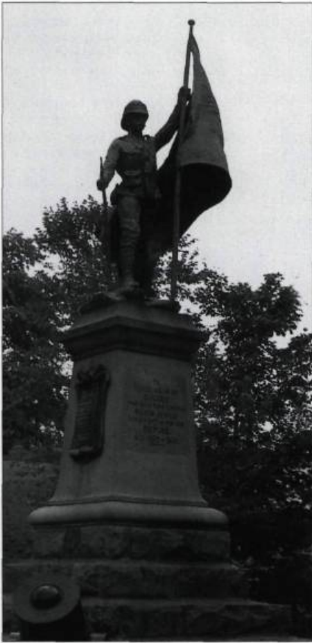
Ce monument inauguré en août 1905 près de la porte Saint-Louis à Québec rappelle la participation des soldats québécois à la guerre des Boers (1899-1902).