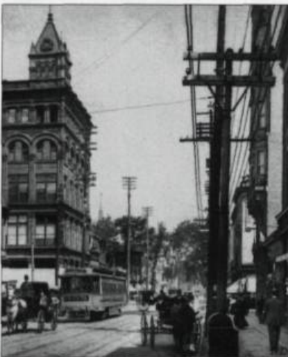
La Belle Époque en est une de révolution technologique. La ville se tisse de fils électriques et les tramways disputent la voie aux voitures à cheval. L'époque est à la vitesse.

L'enseignement de l'histoire, fortement discuté au cours des derniers mois avec la mise sur pied de la «Commission Lacoursière», vient stimuler cette prise de conscience de la nécessité de connaître ses antécédents nationaux et internationaux. La «Coalition pour la promotion de l'histoire au Québec» dont Cap-aux-Diamants fait partie, invite tous les intervenants du milieu de l'éducation à ramener la connaissance historique dans les programmes scolaires, pour former des citoyens qui connaissent leur provenance collective, bien au fait des lignes de force qui ont forgé leur présent et pour mieux saisir l'évolution de la planète. À une époque de grand rapprochement des cultures et des civilisations, l'histoire joue un rôle déterminant, toutes les histoires. Cap-aux-Diamants apporte sa contribution dans le sens d'une éducation historique nationale populaire depuis 1985.