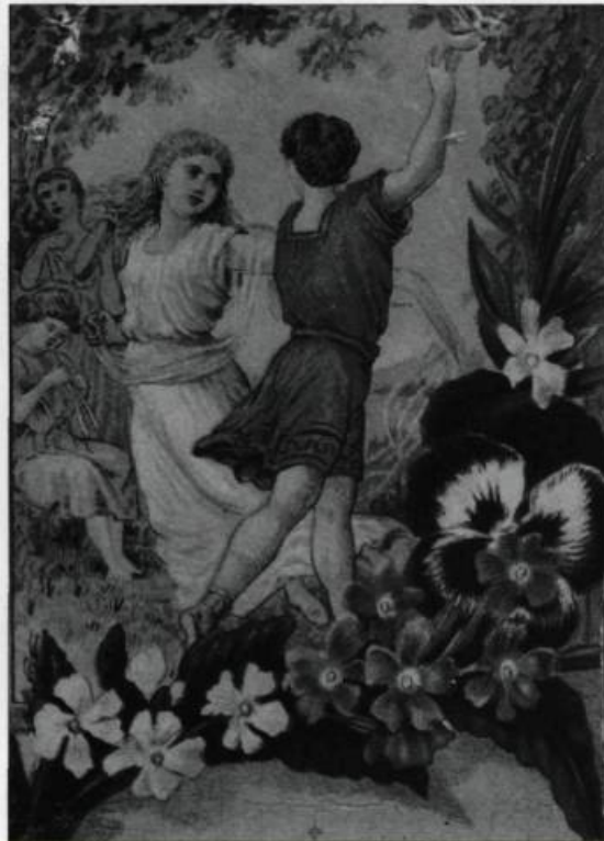
Couple dansant; évocation des fêtes antiques du solstice d'hiver. Carte de souhaits des années 1880..

Le culte solaire au dieu Mithra, dont il a été question, s'était élaboré sur un contenu qui mérite quelque mention. Ce dieu était décrit comme le soleil renaissant dans une grotte alors que des bergers étaient les témoins privilégiés de sa venue. Et ce dieu susceptible de renaissance sur renaissance réussissait à vaincre les ténèbres de