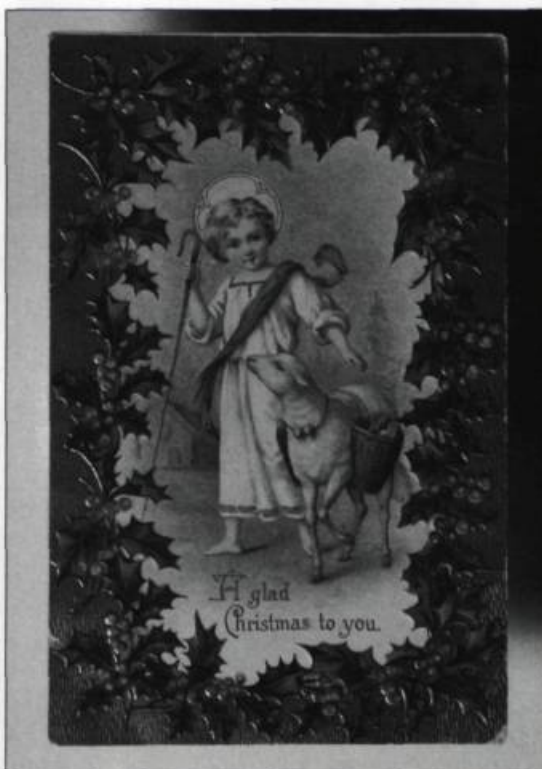
L'Enfant Jésus donateur. Il est accompagné d'un agneau qui porte des présents. Carte de souhaits du début du XX e siècle.

manière naïve, la Vierge, un berger, un agneau et les deux têtes minuscules du bœuf et de l'âne. L'église de Saint-Romuald, paroisse voisine de Lévis, dans la région de la capitale, conserve une nativité réalisée vers 1850 par un peintre de l'école de Munich qui représenta les deux animaux adorateurs. C'était le renouement de l'art académique avec une longue tradition popu-