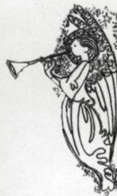
«Il est venu pour souffrir et pour se faire aimer». Le petit Jésus, centre d'attraction de la Noël chrétienne. Carte de souhaits des années 1880. (Collection Reynald Bilodeau).

manière naïve, la Vierge, un berger, un agneau et les deux têtes minuscules du bœuf et de l'âne. L'église de Saint-Romuald, paroisse voisine de Lévis, dans la région de la capitale, conserve une nativité réalisée vers 1850 par un peintre de l'école de Munich qui représenta les deux animaux adorateurs. C'était le renouement de l'art académique avec une longue tradition popu-