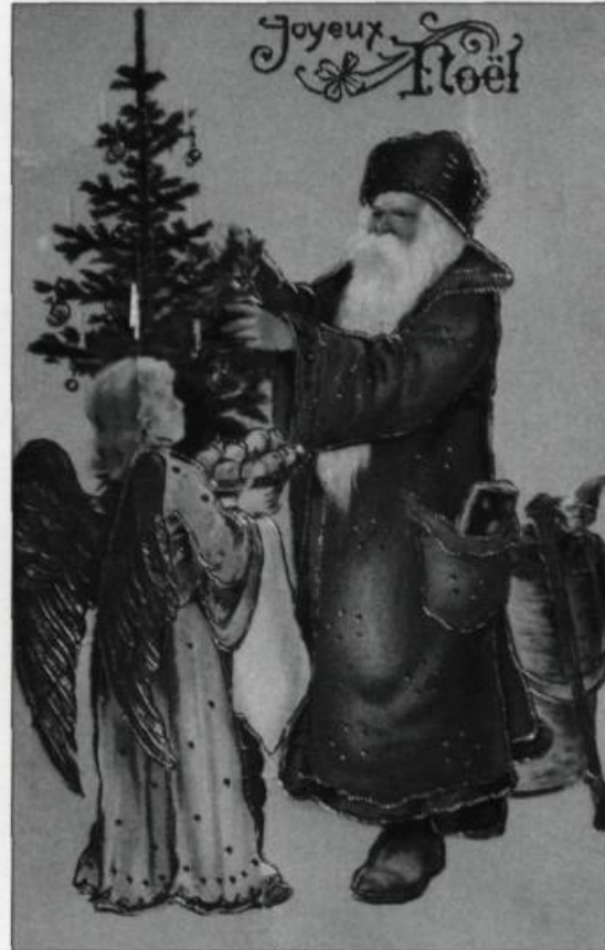
Saint Nicolas, aidé d'un ange, décore de fruits un arbre de Noël. Carte de souhaits de la fin du XIX e siècle. (Collection Reynald Poulin).

serrées au début du XX e siècle, notamment dans Charlevoix où nous avons pu recueillir cette donnée.