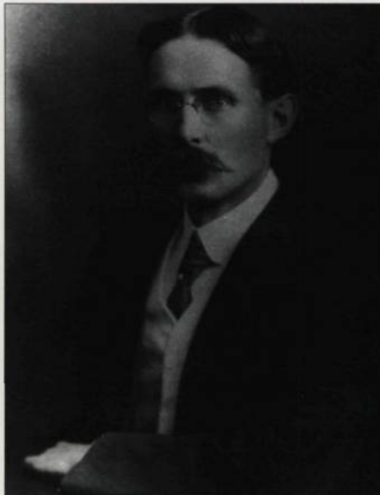
Frederick G. Todd, premier architecte-paysagiste à œuvrer au Canada. Il conçoit les plans et réalise plusieurs parcs au Canada, dont celui du Parc des champs de bataille, en 1909.

L'Angleterre innove par un style, dit le jardin anglais, qui se répand rapidement. Les théories architecturales de John Repton au début du XIX e siècle font école et inspirent plusieurs architectes. Dans les grands parcs à l'anglaise, la disposition de la flore semble toute naturelle et tient compte de la géographie des lieux. Les collines, les tracés courbes des sentiers et des voies carrossables, les lacs et les ponts recréent un environnement champêtre qui contraste avec la rigidité de la ville. Une mise en scène, ponctuée çà et là de fontaines, de jardins floraux et de ruines, élève la sensibilité de celui qui se promène au