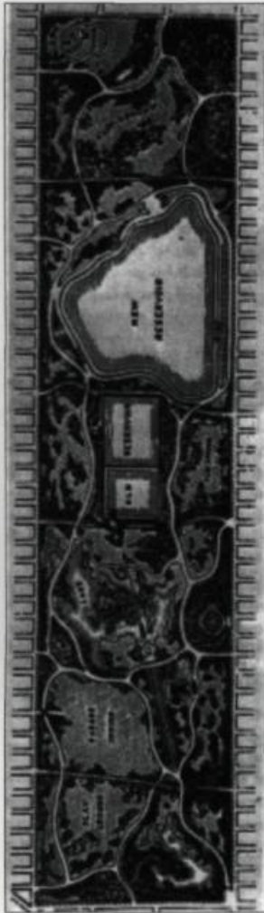
Le plan de Central Park à New York conçu par Frederick Olmsted et Calvert Vaux en 1858. L'aménagement du parc contraste avec la rigidité orthogonale des rues de la métropole. Véritable poumon vert dans cette vaste agglomération, le parc est une aire de repos et de loisir pour des millions de New-Yorkais.

Avec l'éclatement des villes, l'art des jardins publics perd de sa popularité après la Seconde Guerre mondiale. L'étalement urbain témoigne