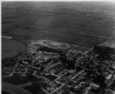
La partie nord-ouest du secteur Limoilou (négatif), 1949, titre basé sur le contenu du document. Archives de la Ville de Québec, séries de vues aériennes du fonds de W.B. Edwards, cote p.12, négatif 23713.

Les vues aériennes du fonds de la Compagnie W.B. Edwards Inc., acquises par la Ville de Québec en février 1993, sont maintenant inventoriées et accessibles aux chercheurs. Les 2 063 négatifs originaux inédits couvrant un demi-siècle d'histoire (1936 à 1990), offrent une source d'informations exceptionnelle sur le développement urbain et la croissance de la ville.