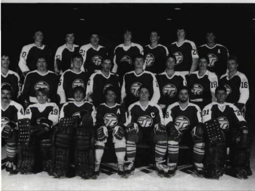
L'équipe de hockey AAA, créée en 1979, disparut en mai 1982. Le chanteur populaire Rock Voisine (en haut à droite) en faisait partie, il portait le chandail numéro 21.

sociale. On en profita alors pour mettre en place et développer de nombreux projets. En 1979, on créa un club de hockey collégial AAA dont fit partie le chanteur populaire Rock Voisine, projet qui prit fin en 1982. Côté culturel, le café étudiant devint, entre 1982 et 1984, le café-théâtre La Passerelle qui servit de lieu de production pour le Théâtre du Repère alors sous la direction de Robert Lepage, où on présenta les pre-