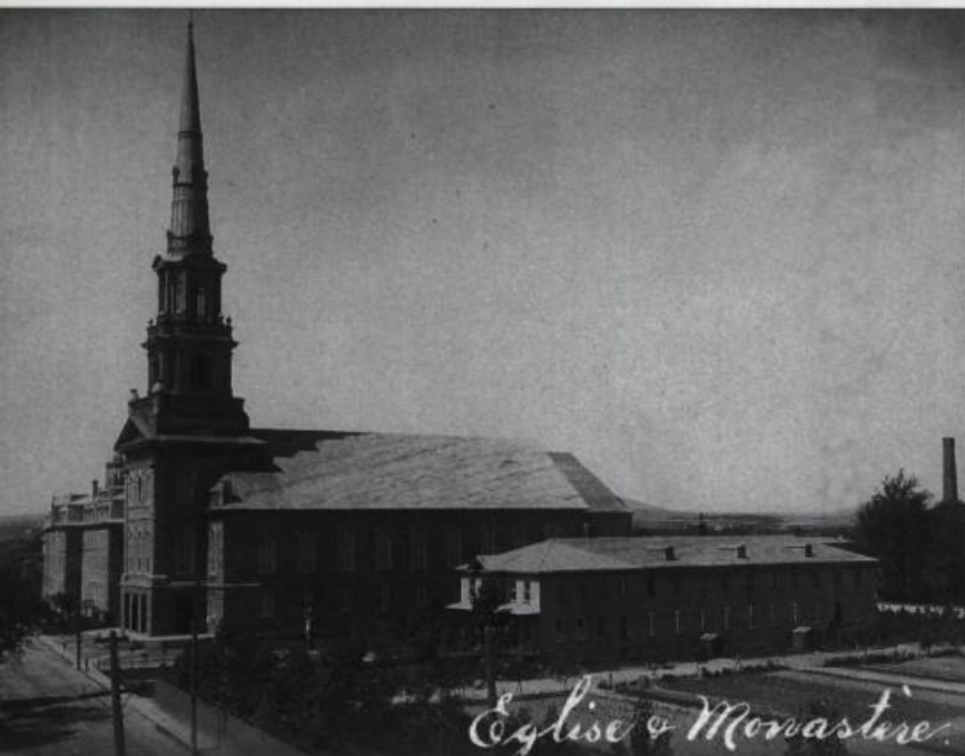
Église de Saint-Charles et le couvent des capucins à sa droite. Ce dernier édifice a été construit en 1903 en incluant le presbytère de 1898.

Les capucins de Limoilou appartiennent à la grande famille de l'ordre des Frères mineurs fondé au XIII e siècle par François d'Assise. En 1525, un religieux de cet ordre, Mathieu de Basci, obtint du pape l'autorisation de s'appliquer à