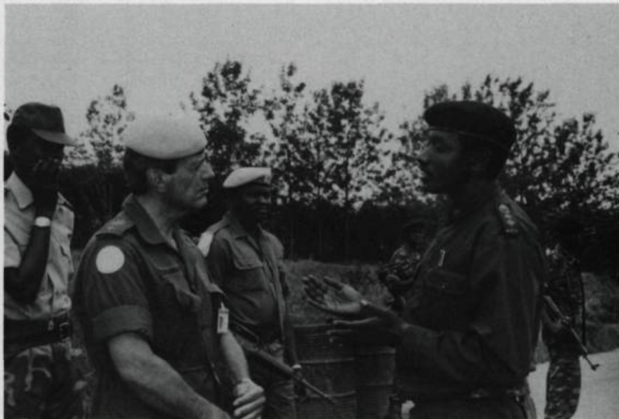
Le major général Tousignant a assuré la relève du major général Dallaire au Rwanda. On le voit rencontrant d'autres militaires.

Pour terminer soulignons que la maintien de la paix implique une volonté des protagonistes à faire cesser les hostilités. Mais que faire lorsque les ennemis refusent? On peut alors imposer la paix et équiper les troupes canadiennes en con-