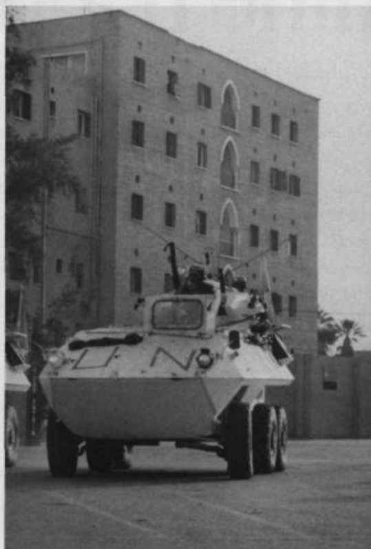
Char blindé à Chypre. Pendant 28 ans les Canadiens ont participé à cette mission des Nations Unies.

séquence, ou bien encore déployer des troupes à une politique cohérente pour guider leur action, comme le démontre si bien l'expérience des Casques bleus dans l'ex-Yougoslavie. N'est-il pas temps de mieux cibler notre aide internationale et d'aider ceux qui veulent réellement faire la paix? ♦