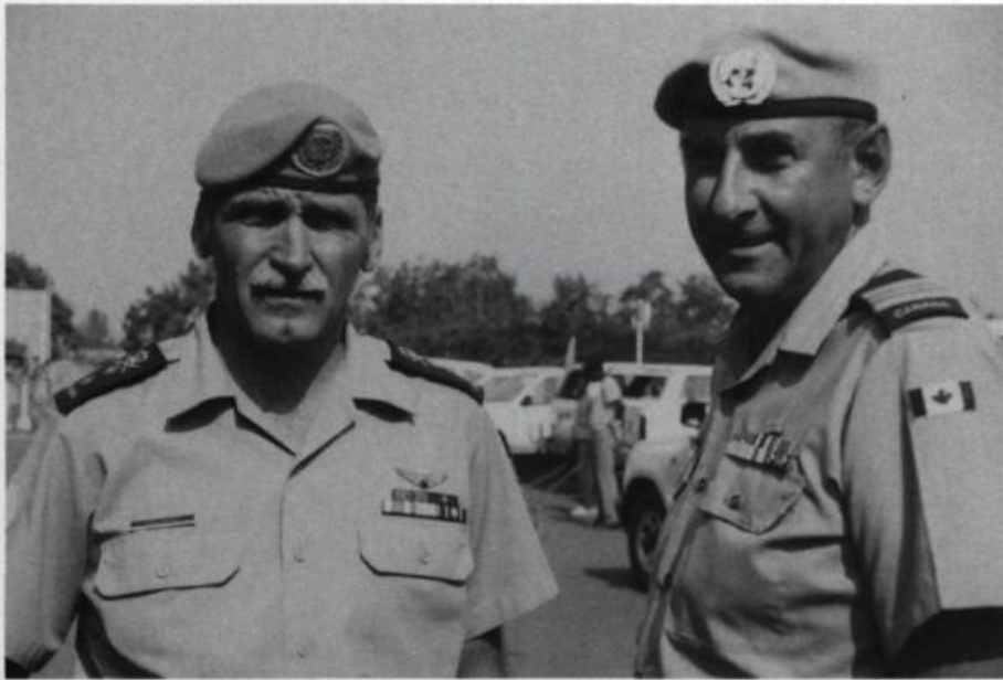
Figure de proue, le major général Roméo Dallaire commanda les troupes des Nations Unies au Rwanda. (UPFC, ISC 94-2114).