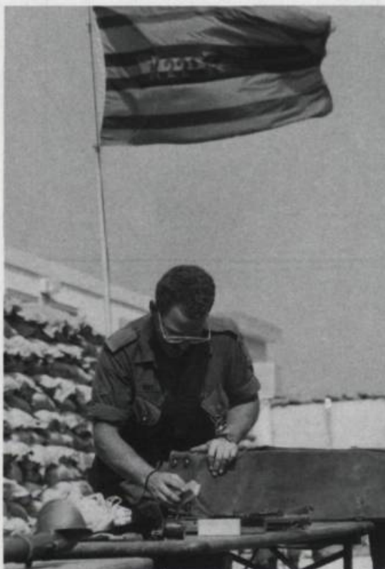
Un soldat canadien du Royal 22 e régiment nettoie son arme personnelle pendant la guerre du Golfe, en 1990-1991.

de la Belgique me félicitant. J'ai simplement répondu qu'il ne s'agissait pas d'un acte de bravoure, mais du fait que j'avais pu m'adresser en anglais aux Ghanéens et en français aux Belges et Congolais et que cela avait démontré hors de