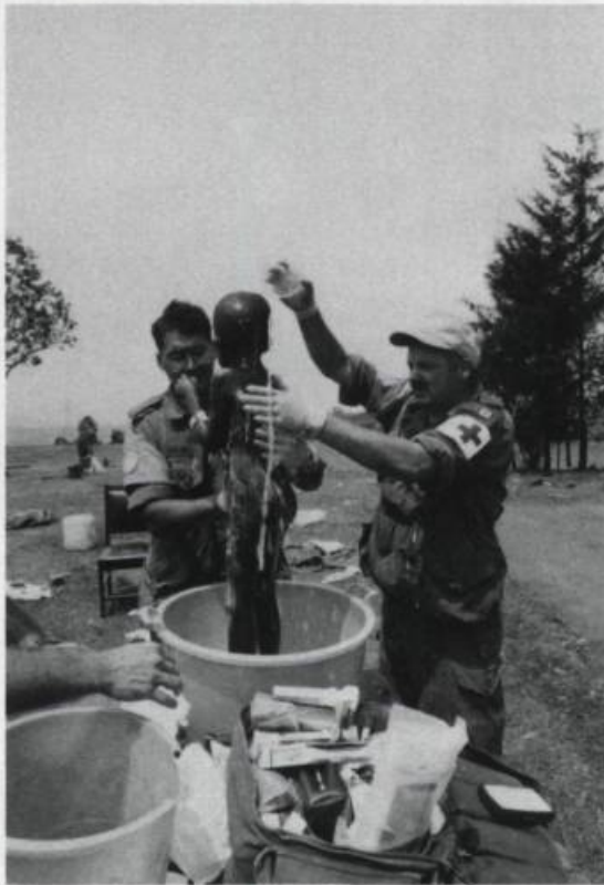
Rendre service à la population rwandaise signifie aussi pour les militaires canadiens : donner des soins médicaux.

tout doute l'avantage de connaître plus d'une langue».