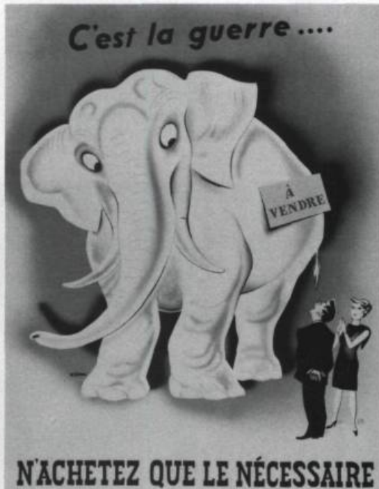
«N'achetez pas d'éléphant blanc!». Campagne contre le gaspillage et la surconsommation pendant la guerre.

Le monde rural est aussi mis à contribution pendant les deux guerres et il demandera une juste part des bénéfices en résultant. Après la Première Guerre, le mouvement agraire de protestation du Canada fera une percée au Québec et suscitera une effervescence idéologique qui aboutira en 1924, après bien des péripéties, à la création de l'Union catholique des cultivateurs (UCC).