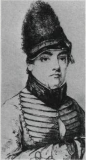
Jacques Viger portant l'uniforme de capitaine des Voltigeurs canadiens, 1812-1813.

prend fin avec la cessation des hostilités et la dissolution des unités. Retranchés de nouveau au sein de la milice sédentaire, les officiers francophones n'ont pas la retraite facile, en raison des luttes politiques qui se préparent au Bas-Canada. La constitution du corps des officiers de milice se fait alors selon une division ethnique et politique très nette. Par exemple, à Montréal en 1824, les Papineau, Bédard et Viger appartiennent au 2 e bataillon alors que les Forsyth, Gerrard et McGill détiennent des commissions au 1 er bataillon. Les querelles politiques sont ainsi transposées dans la milice. Le gouverneur Dalhousie se chargera d'ailleurs de purger le corps des officiers de la milice sédentaire en forçant ceux d'entre eux qui ne partagent pas ses opinions - à donner leur démission et à prendre leur retraite. 88 officiers sont ainsi démis, 245 mis à la retraite et 99 placés sur une liste de surnuméraires. Jamais la milice ne s'en remettra, et la perception de cette institution par les francophones en restera marquée à jamais.