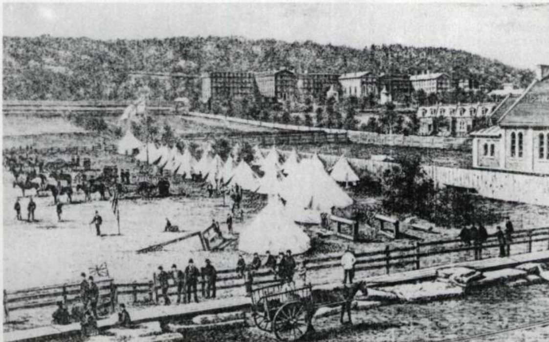
Camp de la milice à Montréal, avec en arrière-plan le collège des sulpiciens (collège de Montréal) vers 1855-1856.

L'année 1855 est une date marquante dans la professionnalisation du système de milice canadienne. Aiguillonné par le départ des troupes britanniques pour la guerre de Crimée, le gouvernement de l'Union appelle 5 000 volontaires sous les drapeaux. Avec cette loi, la milice sédentaire commence à sombrer dans l'oubli. Dorénavant, seule la milice volontaire et ses officiers compteront. La milice volontaire apparaît elle aussi comme un indicateur social puisque ses officiers sont, au départ, issus de la milice sédentaire par ordre de séniorité. L'étape la plus importante dans le processus de professionnalisation de la milice sera déclenchée par celui-là même qui présidera aux destinées de la nouvelle puissance (ou Dominion, en anglais) du Canada en 1867, John A. Macdonald. La guerre de Sécession, qui fait rage aux États-Unis, en effraie plus d'un au Canada et elle pousse Macdonald, en 1862, à entreprendre un vigoureux renouvellement du corps des officiers de milice où l'instruction militaire est valorisée pour préparer la voie à une guerre éventuelle. Pour ce faire, on incite à la retraite les officiers de mi-