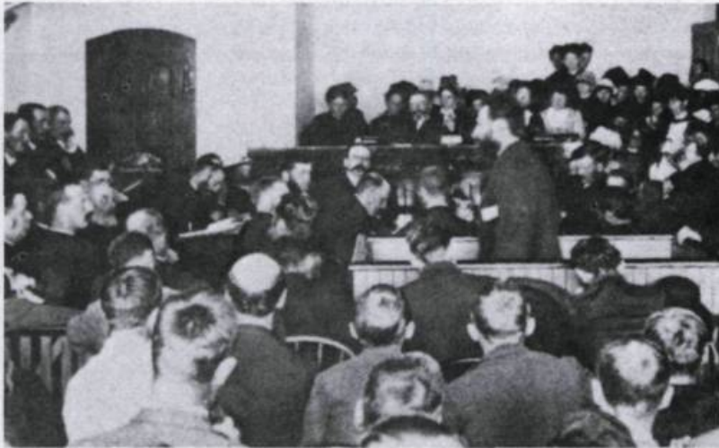
À l'issue de la défaite de Batoche, Louis Riel n'a d'autre choix que de se rendre. C'est ce qu'il fait le 15 mai. Amené à Régina, il y est jugé à partir du 20 juillet 1885. Nous le voyons ici s'adressant aux membres du jury.