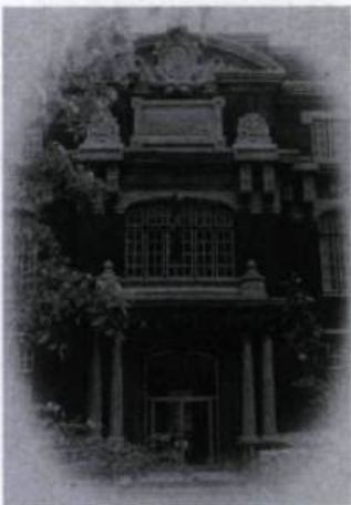
LE CENTRE DE PRODUCTION ARTISTIQUE ET CULTURELLE ALYNE-LEBEL