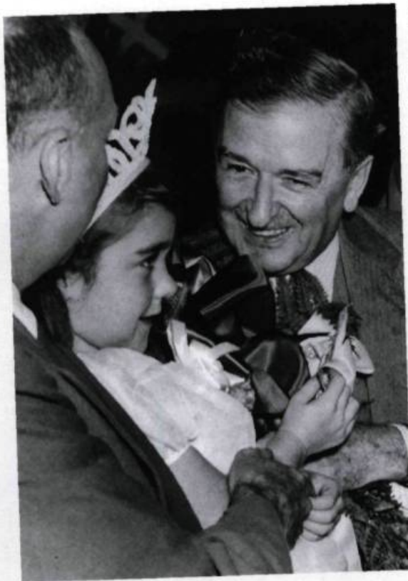
Maurice Duplessis fait adopter au cours de son premier mandat comme premier ministre la Loi sur l'assistance aux mères nécessiteuses, 1937.

qu'avait été votée la Loi concernant la fréquentation scolaire obligatoire , sous ce même gouvernement.