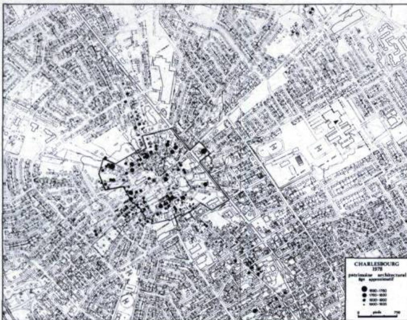
Le Trait-carré de Charlesbourg décrété arrondissement historique en 1965.

seuls monuments correspondant à la valeur architecturale et, dans une moindre mesure, historique estampillée du Régime français. La Commission restreint ainsi son champ d'intervention aux lieux d'habitation les plus anciens, soit ceux de la vallée du Saint-Laurent. Les commissaires sillonnent le Québec pour informer les propriétaires de maisons ou d'églises