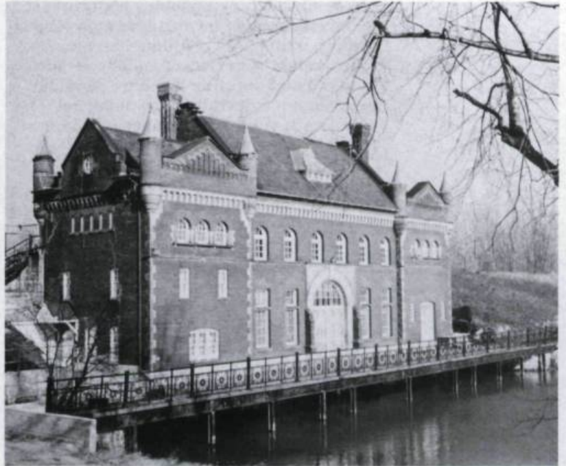
L'ancienne usine hydroélectrique Les Cèdres, classée en 1984. (Archives de la Commission des biens culturels).

Le rythme des classements se poursuit de 1979 à 1985. Le patrimoine résidentiel est toujours le plus touché, suivi du patrimoine religieux. On constate cependant une certaine ouverture au classement de bâtiments administratifs, surtout dans le domaine scolaire, et de bâtiments commerciaux et industriels.