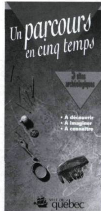
William Moss et Henriette Thériault (dir). Un parcours en cinq temps . Québec: Ville de Québec, Bureau des arts et de la culture, Service de l'urbanisme en collaboration avec le Service des communications et des relations extérieures, 1993, 37 p.

Résultat d'une action concertée de dix-huit musées et centres d'interprétation de Québec, la publication propose 33 sorties éducatives pour le primaire et le secondaire, choisies en fonction de la thématique: Québec, ville mémoire. Admirablement bien conçu, c'est un outil de planification de premier ordre pour les activités pédagogiques. La publication de la brochure a été rendue possible grâce à la participation financière du ministère de la Culture, du ministère de l'Éducation et de la Ville de Québec. C.L.