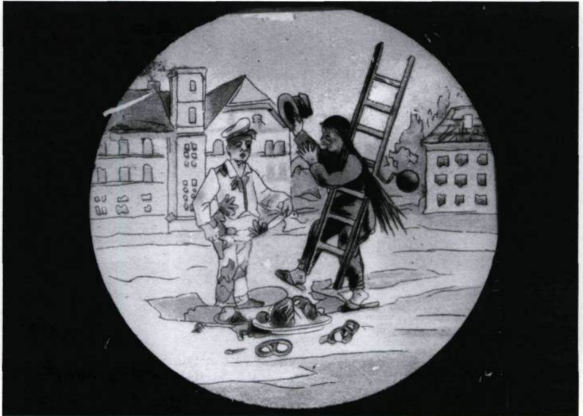
Rencontre imprévue du ramoneur de cheminée et du pâtissier.

Mais le quêteux fait peur aussi, surtout s'il possède la capacité de jeter des sorts. Son allure physique attire l'attention; il porte un costume délabré, un bâton et un baluchon au contenu secret.