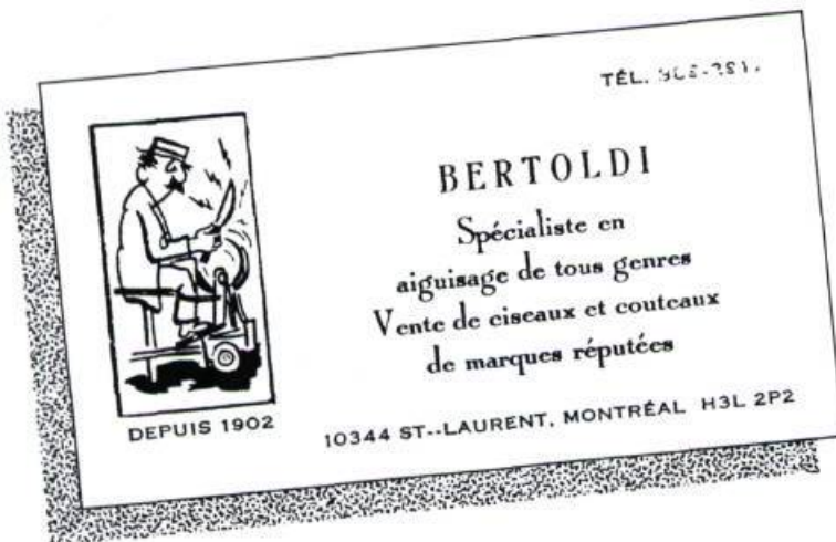
«Carte d'affaires».

«Cuillères, cuillères à fondre; Apportez vos morceaux; Voilà le fondeur de cuillères.»