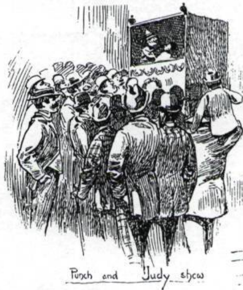
Le montreur de marionnettes.