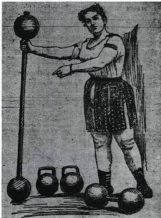
Le culte des femmes fortes. («La Patrie», 2 novembre 1899).