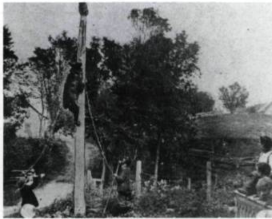
«Grimpez Martin!». («Album universel», 13 janvier 1906).

Joseph-Édouard Guilbault, du célèbre jardin portant son nom, s'applique beaucoup à développer les talents du pays. De 1842 à 1870, ce véritable Barnum forme des trapézistes, des funambules, des contorsionnistes, des jongleurs, des pantomimes à ce point virtuoses qu'on les retrouve dans des troupes qui parcourent le globe. La