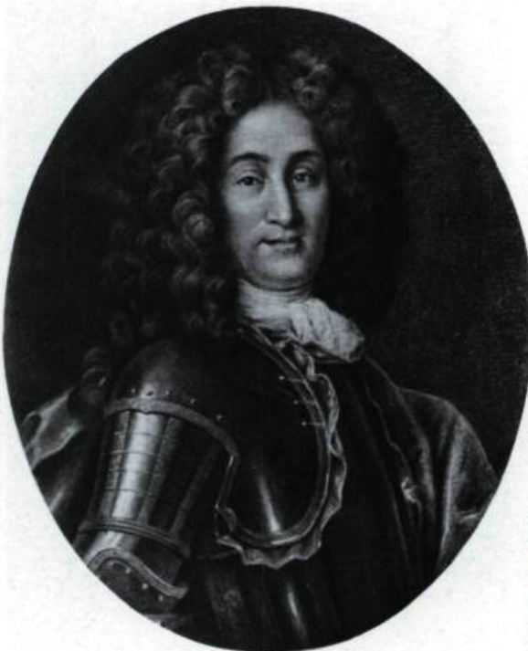
Charles Lemoyne de Longueuil et de Châteauguay (1626-1685). Il fut anobli par Louis XIV en 1668.

Ainsi, il est sûrement moins lié à un fondement juridique que sa contrepartie française, et beaucoup plus près de l'ancien idéal militaire