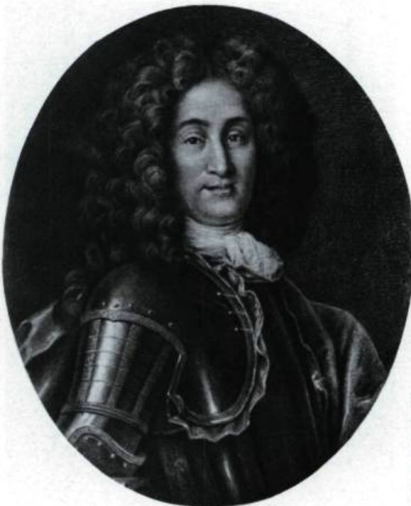
Charles Lemoyne de Longueuil et de Châteauguay (1626-1685). Il fut anobli par Louis XIV en 1668.

Ainsi, il est sûrement moins lié à un fondement juridique que sa contrepartie française, et beaucoup plus près de l'ancien idéal militaire