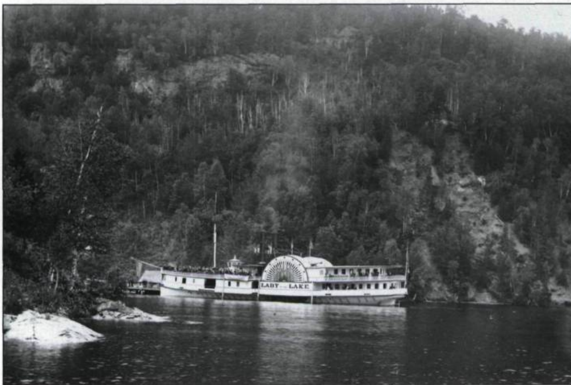
«Le Lady of the Lake sur le lac Memphrémagog vers 1895». Les compagnies de chemin de fer auront recours aux talents des peintres et des photographes afin de promouvoir les régions ouvertes à la villégiature en défrayant maintes fois leurs frais de voyage et de séjour. Photo de William Notman et fils. (Archives photographiques Notman. Musée McCord d'histoire canadienne, Montréal).

lanta en Georgie, vient chaque été avec deux wagons logeant ses dix-huit serviteurs noirs, dix chevaux et plusieurs carrosses et s'installe dans sa somptueuse résidence de North Hatley. La villa est une réplique de Mount Vernon, la maison de George Washington. Aujourd'hui, l'auberge Manoir Hovey occupe cet édifice. Et tous ceux qui veulent profiter en toute saison du paysage idyllique, des somptueux jardins, d'une hospi-