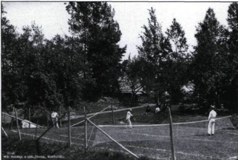
«Lawn tennis au lac Memphrémagog vers 1895». Parmi les loisirs de villégiature les jeux sur gazon tels le boulingrin, le tennis, le golf, le croquet sont les favoris.

Magog marquant ainsi ces espaces d'une bourgeoisie naissante prenant modèle chez les Anglo-saxons de la région.