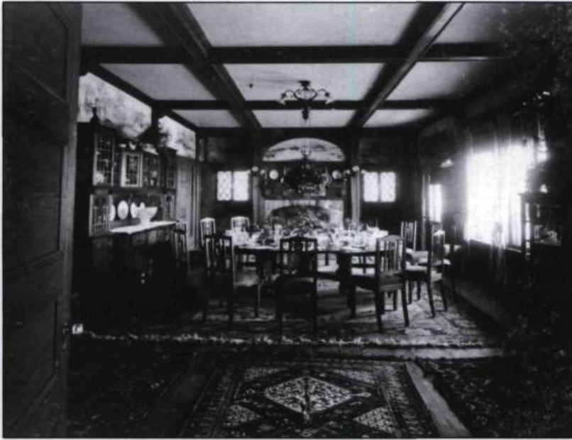
La salle à manger de Gil'Mont peut accueillir jusqu'à 24 convives. Tapis persan, mobilier lourd et austère en chêne noir dans l'esprit de celui de Gustav Stikley, fresques murales, voilà autant d'éléments de l'aménagement d'une pièce fort importante dans la saison des vacances. Le centre de la table est agrémenté d'un surtout d'argent ou de verre. 1906.

Les 54 images en grand format, réalisées en 1906, offrent une véritable visite guidée de la villa construite cinq ans plus tôt et de la dizaine de dépendances composant la ferme modèle. Les jardins sculptés à la française, les boisés de feuillus et de conifères aux sentiers rocailleux, le potager et l'enclos des cerfs sauvages en voie de domestication sont autant de clichés donnant un juste aperçu de l'étendue du domaine s'étirant de la forêt jusqu'au fleuve, bordé par une plage et un quai d'accès. La propriété, étagée sur trois