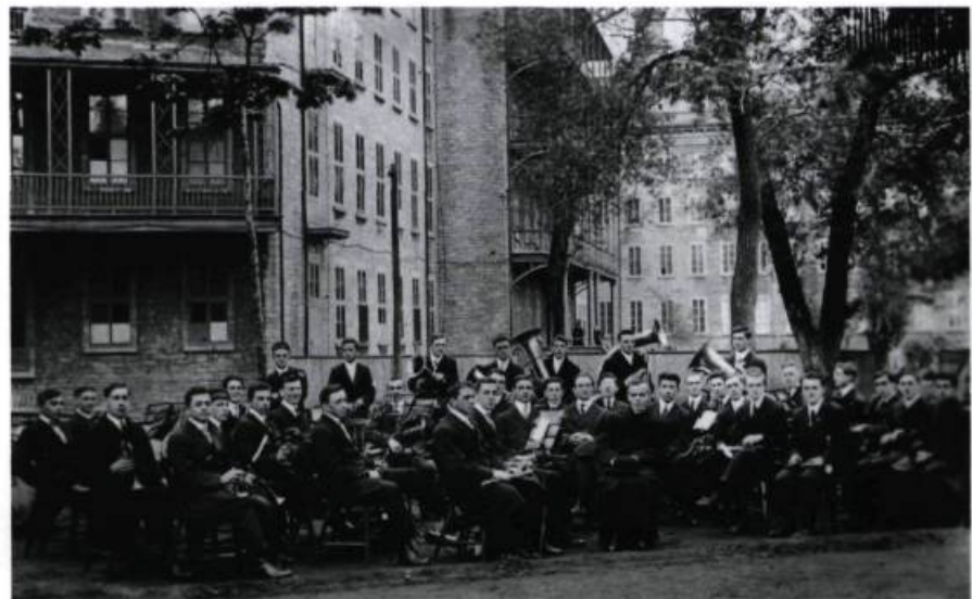
Fanfare du Petit Séminaire de Québec. (Académie Sainte-Cécile). Photo prise pendant l'année scolaire 1915-1916.