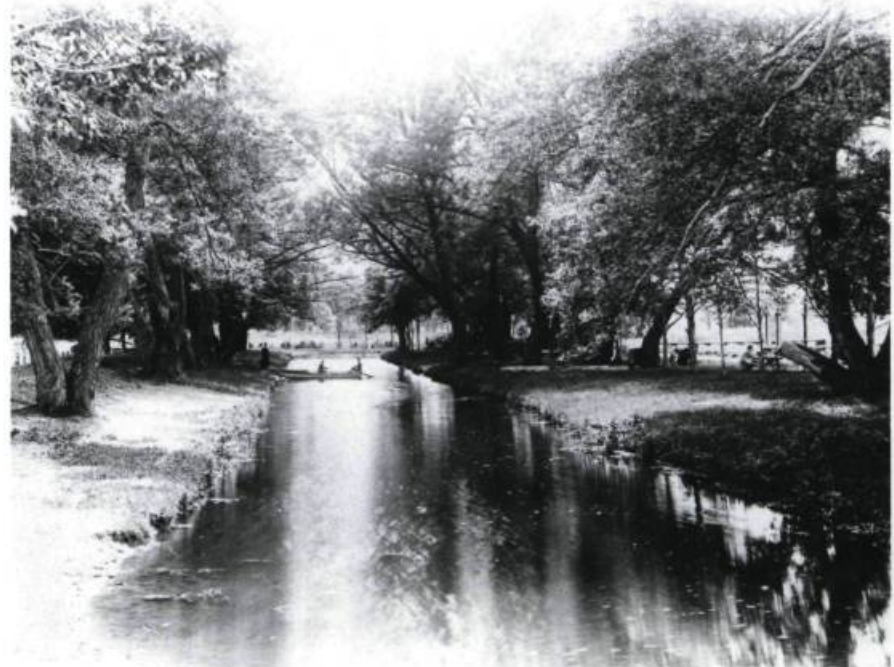
Vue de l'étang du domaine de Maizerets en juillet 1912.