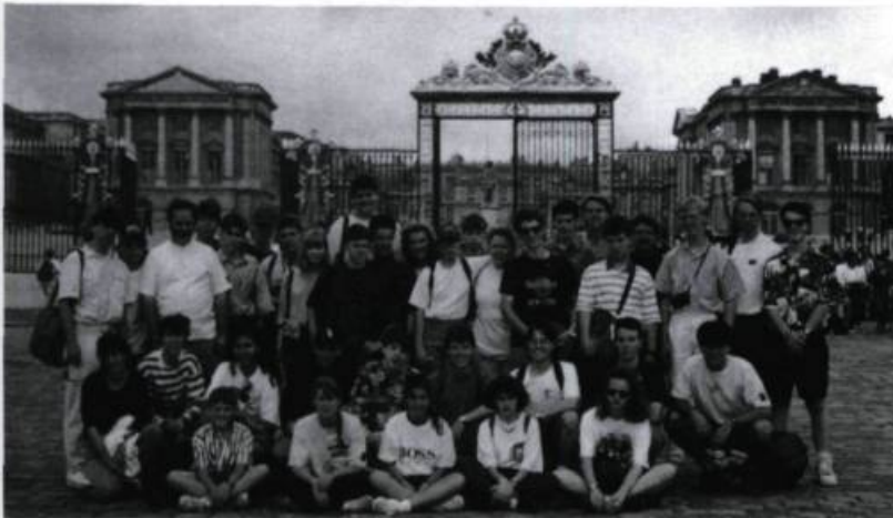
L'Orchestre d'harmonie senior, en voyage en France, pose devant la grille du château de Versailles. («L'Abeille», vol. 39, n° 2, automne-hiver 1993).

Les cuivres et les bois sont naturellement à l'honneur, pour alimenter la Société Sainte-Cécile. Gare aux oreilles sensibles, si l'on en juge par ce commentaire de Joseph-Edmond Roy, pensionnaire entre 1867 et 1877: La musique instrumentale, placée aux heures de récréation, est cultivée avec peut-être trop d'ardeur. C'est à dire que le Canadien, comme ses pères les Français, aime le bruit, surtout le bruit cadencé [...] .