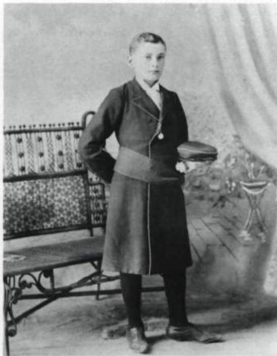
Le «suisse» sera le costume officiel du Petit Séminaire de Québec jusqu'en 1943. Il sera alors remplacé par le «blazer». Photo de A.-R. Roy, 1897 et photo anonyme, 2 juin 1956. (Archives du Séminaire de Québec).

Dans les classes de grammaire, soit les quatre premières années, on fait surtout des langues mortes et du français. Le latin est enseigné sans les ménagements d'aujourd'hui. Des thèmes et des versions qui nous promènent en compagnie d'Ulysse ou d'Achille nous aident un peu à digérer les déclinaisons et les conjugaisons. En Rhétorique, on saura assez de latin pour traduire Tacite à coups de dictionnaire mais pas assez pour faire des vers latins comme au temps d'écolier de l'ancien cardinal-archevêque de Québec,