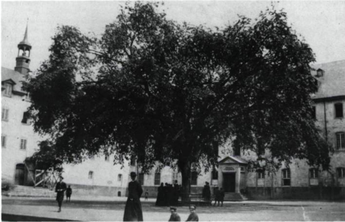
La cour des petits où trône depuis 1860 le célèbre orme. Le vieil arbre disparaîtra du terrain de jeu des jeunes élèves en 1941. Photographie, 1927.