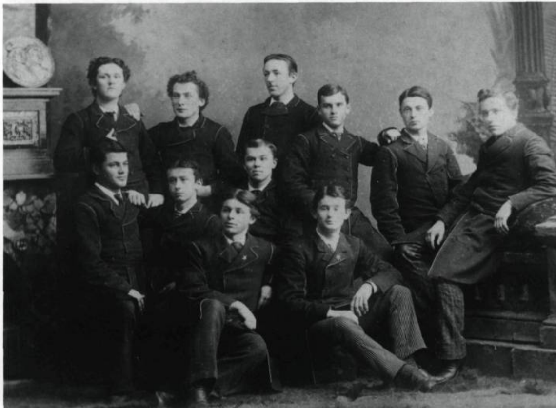
Groupe d'étudiants du Petit Séminaire de Québec. vers 1890.

Dans ce Petit Séminaire où la vie est régentée par les horloges et les cloches, les élèves apprennent les langues grecque, latine, française, anglaise, l'histoire, la géographie, les mathématiques, les sciences et la philosophie. Ils y découvrent le monde et se voient inculquer une explication du monde. Les enfants, qui à leur entrée à l'âge de dix ans s'amuse à jouer aux