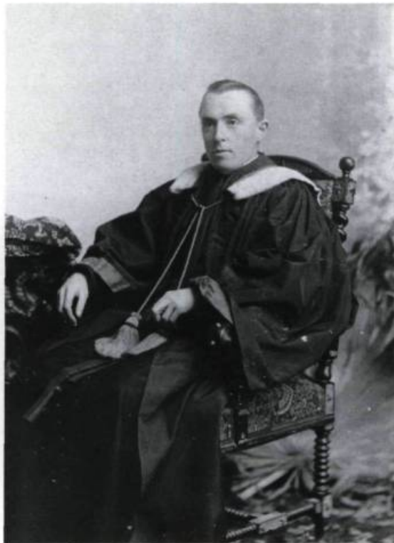
L'abbé Olivier-Elzéar Mathieu, futur archevêque de Régina, est le supérieur du Séminaire de Québec de 1899 à 1908.

Deux cent quatre-vingt-dix élèves sont dits externes. Ce sont les élèves dont les parents résident dans la ville. Plusieurs d'entre eux viennent des grandes familles de la vieille capitale: les Ahern, Cannon, Delage, Duchesnay, Fitzpatrick, Frémont, Flynn, Garneau, Gauvreau, Hamel, LaRue, Livernois, Taschereau et autres.