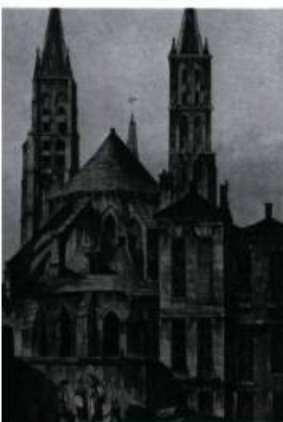
Le 6 décembre 1658, François de Laval est consacré évêque de Pétrée dans la chapelle de la Vierge de l'abbaye de Saint-Germain-des-Prés à Paris. Illustration de J. Hill d'après un dessin de J.C. Natter, vers 1810. (Archives de l'abbé Jean-Marie Thivierge).