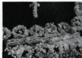
Les restes de M sr de Laval présentés au public avant la translation officielle du 23 mai 1878. Photo de Jules-Ernest Livernois, 1878. (Collection initiale. Archives nationales du Québec à Québec).